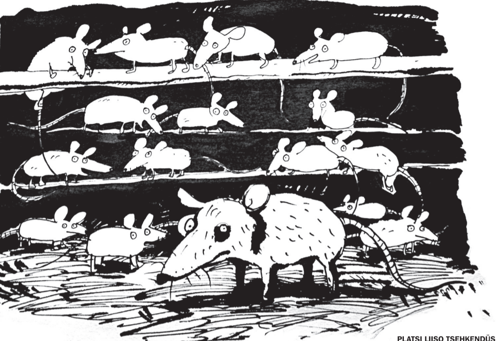
PLATSII LIISO TSEHKENDÜS

Innembä (ka kolhoosiaol) kuivati tan villä, sis mustõ palkõ pääl paistu nä peris helle halli, altpuult piaaigu valgõ. Tuli paistu ussõ kotsilt üleväst, rehetarõ ussõ