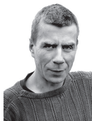
RUITLASÕ OLAVI, testitü jordo

A ma murdnu hää meelega mõnõl pargin kakõrdajal kepikõndjal kepi alt är.