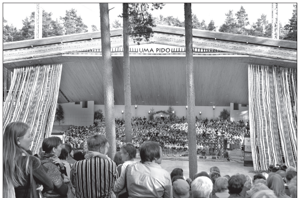
HARJU ÜLLE PILT

Võistlusõl üttenlõümise iist määnestki massu ei küstä, õnnõ