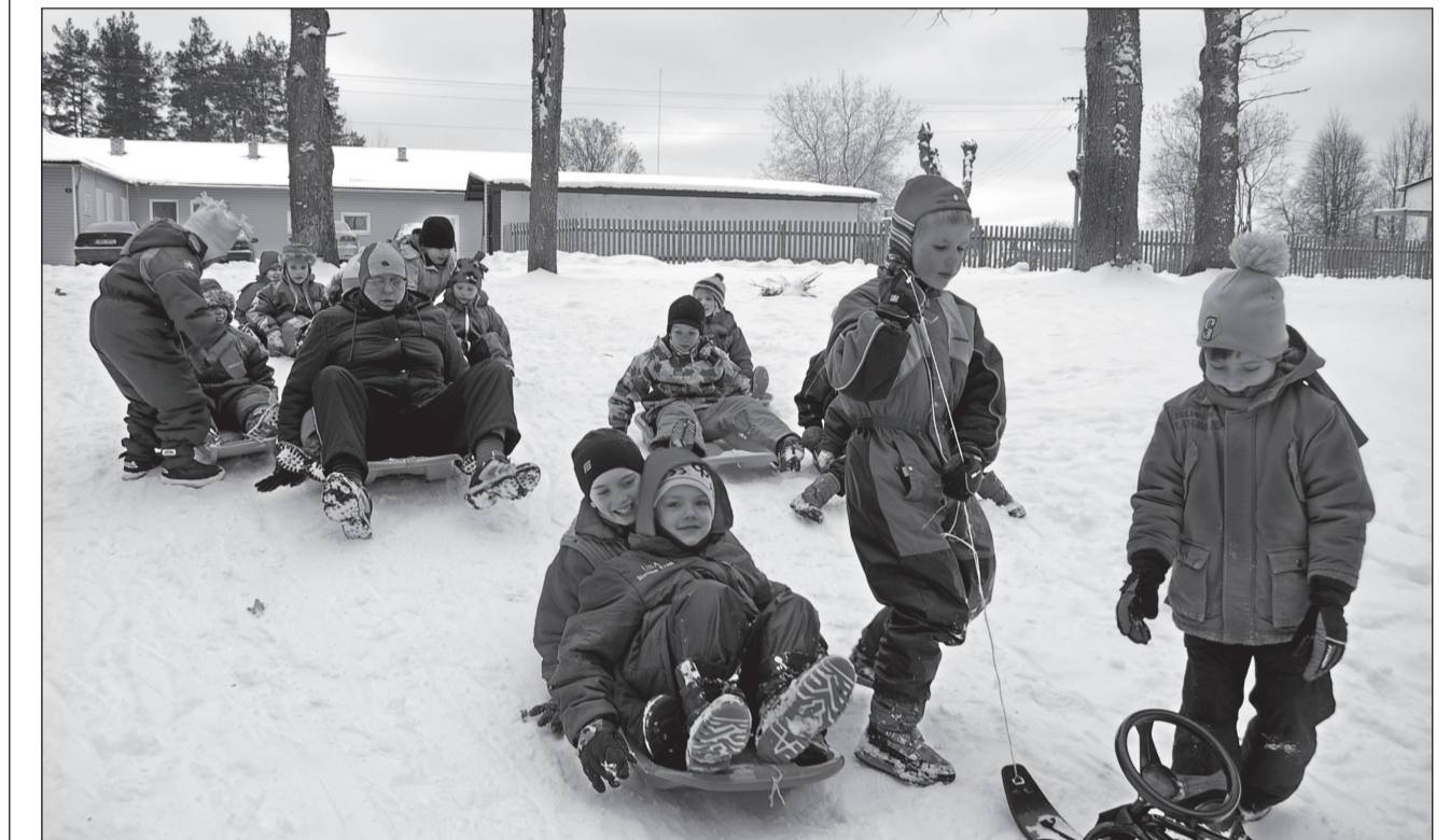
HARJU ÜLLE PILT

Timahavanõ vastlapäiv (Võromaal om üteldü ka pudropäiv, lihahiide) trehväs seokõrd kokko vabariigi aastapääväga. Et tuu oll' riigipühä ja vaba päiv, sis saiva kõik kasvai terve päävä vastlasõitu tetä, ku õnnõ himostiva. Vastlapäävä ilma perrä kai vanarahvas suvist saaki. Vahtsõliina rahvas usksõ selgest taivast hääd rükä. A Põlva kandin tähend lumõsado hüvvä mehidsaastakka. Päiv päält vastlapäivä om tuhapäiv (tuhkapäiv). Urvastõ kandist om üles kirotot, et tuul pääväl küdseti tuha all karaskit. Pildi pääl harotasõ vastlasõitu Sõmmõrpalõ latsiaia latsõ.