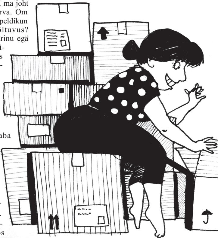
PLATSI LIISO TSEHKENDÜS

Täambädsel pääväl om asi lihtsä – ku midägi väega himostat, võta pangast lainu vai telli kataloogõst perä-