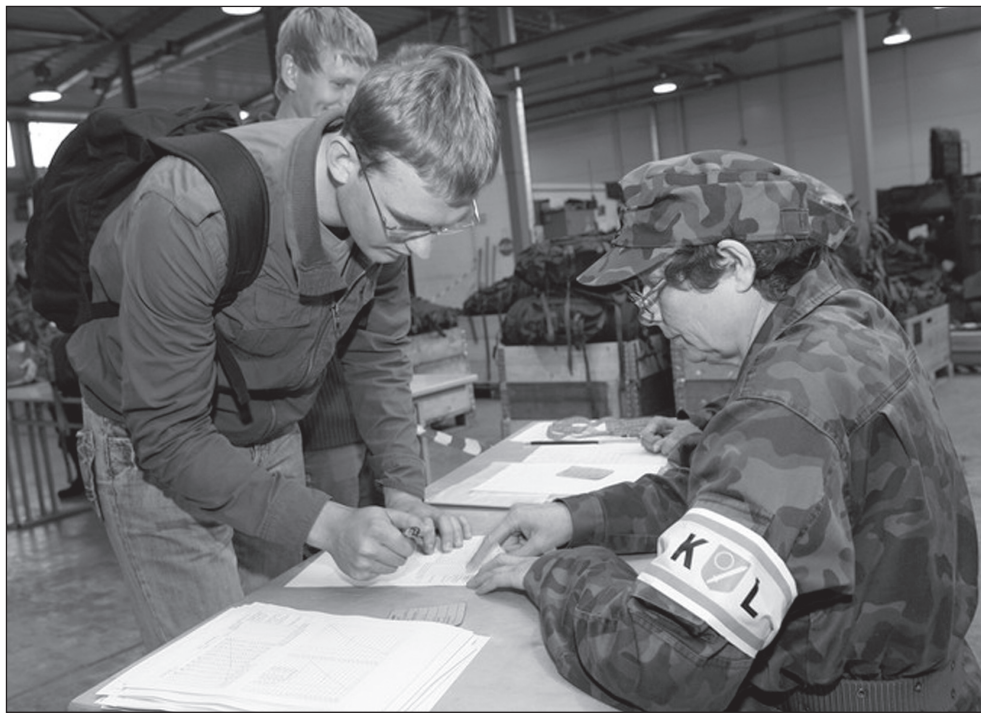
Kättesaadu varustusõ kotsilõ pidi andma allkirä, et kõik kallis kraam iks tagasi jõudnu.