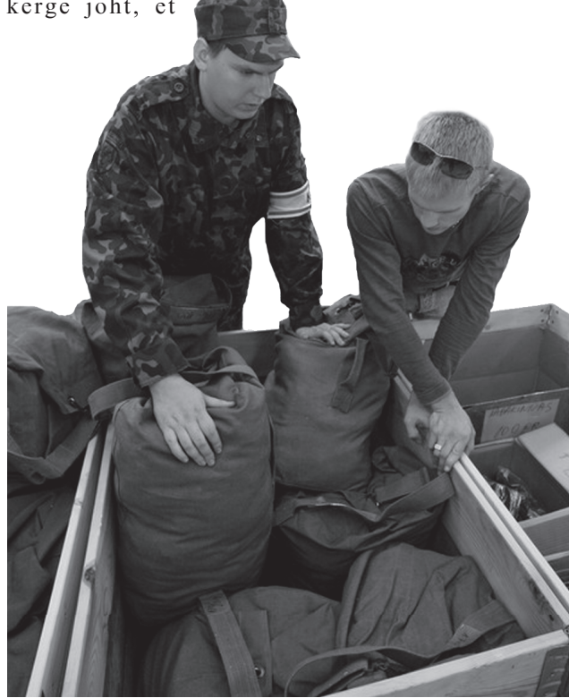
Poisi saava varustusõ kätte.

Egäleütele jagat kraam pantõ kõrraligult kirja, et kõik asä iks päält oppust ilosahe õigõ kotussõ pääle tagasi kah jõudnu.