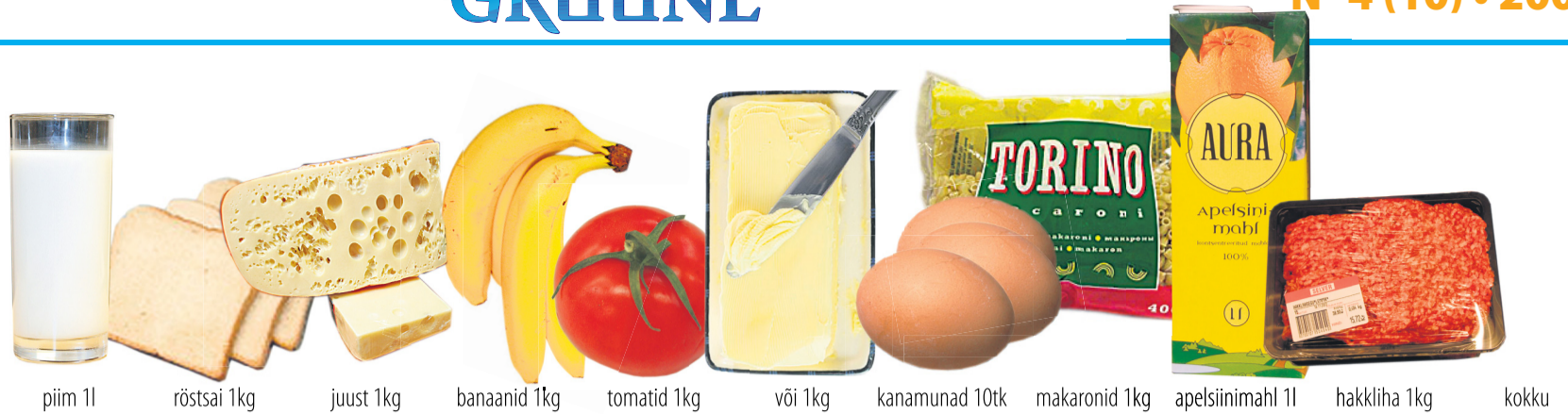
piim 1l röstisai 1kg juust 1kg banaanid 1kg tomatid 1kg või 1kg kanamunad 10tk makaronid 1kg apelsiinimahl 1l hakliha 1kg kokku