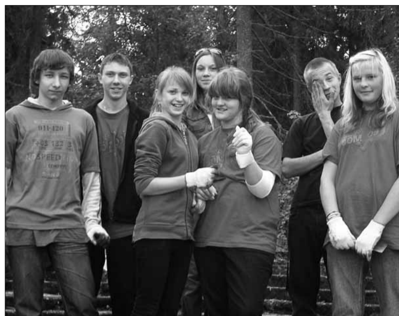
Malevlased Tapa laululava koristamas.

Vana kalmistut koristades meenub üks seik, kus noored tulid minu juurde ja ütlesid kurvast, et näe üks perekond läks mööda ning mees ja naine lükates lapsevankrit arutasid omavahel, et no milleks seda kalmistut siin hoitakse võiks hoopis parkla teha selle asemele. Istusime noortega maha ja arutlesime väärtuste üle, mida peaks iga täiskasva-