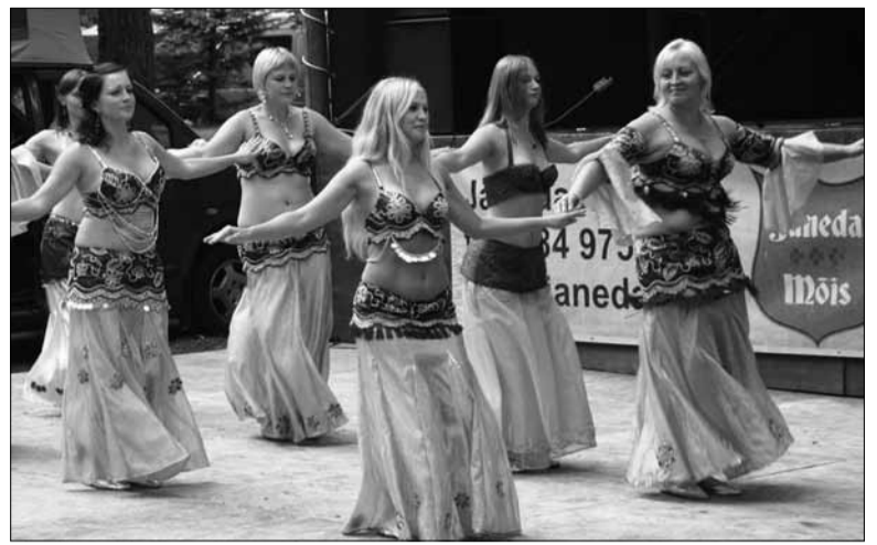
Jänedal kõhutantsijad lumuvad oma graatsilisusega.