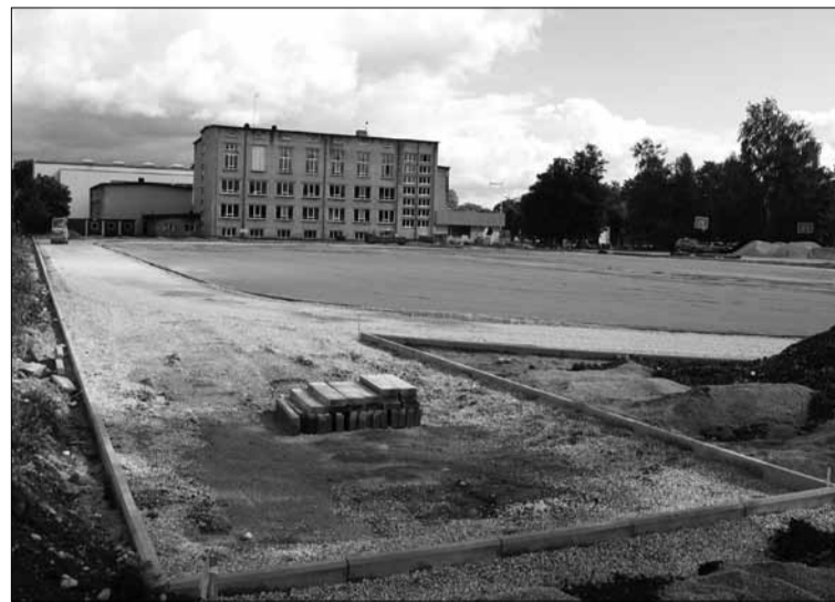
Pärast renoveerimist saab gümnaasiumi staadion täielikult uue ilme.

Kooli staadioni osas on tegemist täiesti uue ehitusega, mis on projekteeritud ja ehitatud kaasaja nõudeid ja vajadusi silmas pidades. Staadion paikneb vana staadioni kohal ning hõlmab endas jalgpalliväljakut, mida