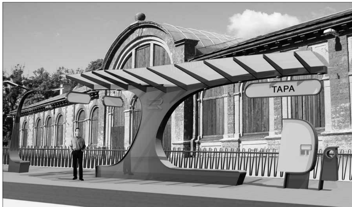
Kas vaksali perroon koos varikatusega hakkab tulevikus välja nägema fotol kujutatuna?

Graafika arhitektuuribüroo Luhse & Tuhal, Liina Kald