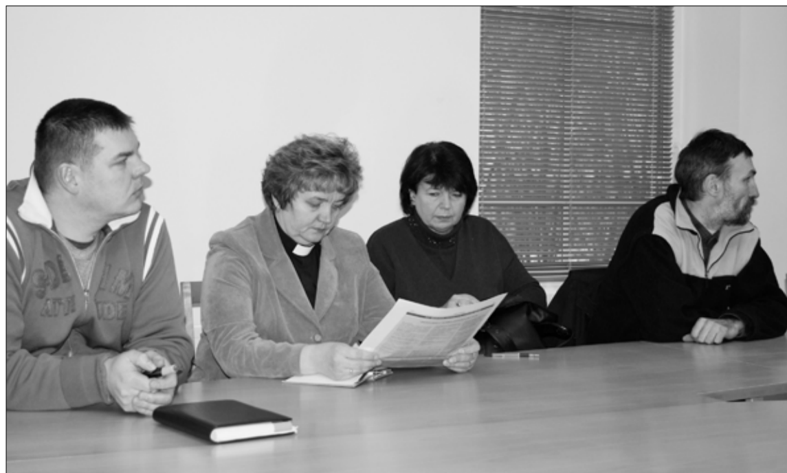
Vallamajas toimunud LEADER infopäeval oli osavõtjaid valla eri piirkondadest.