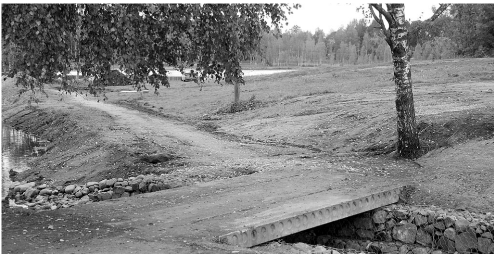
Betoonpaneelist sillalt viib otsetee kasetüve ja mullaperveni. Turvaliselt saab üle oja silda diagonaalselt ületades.