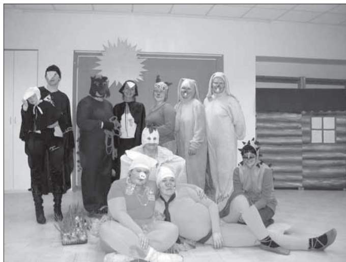
Näitetrupp täies koosseisus.

Märts on lasteaia sünnipäevakuu, sel aastal tähistab Puhja Lasteaed oma 30. juubelit. Loodan, et kutsutud endised töötajad, lasteaia head toetajad ja vilistlased saavad kuu lõpus toi-