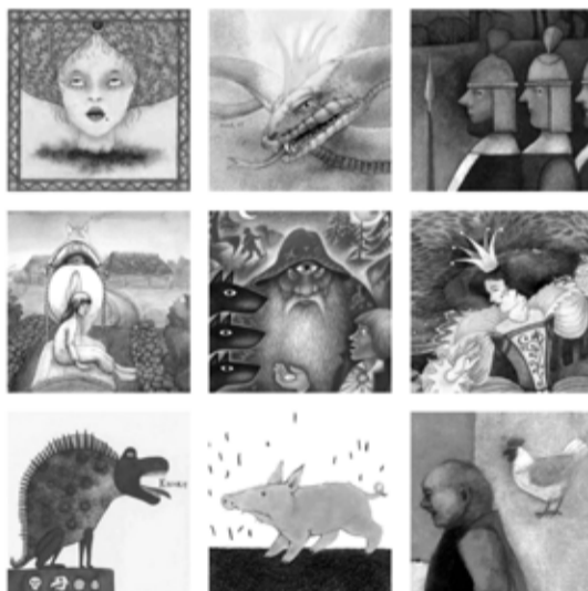
Fr. R. Kreutzwaldi loomingule pühendatud Eesti kunstnike näitus