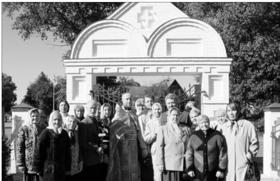
Первое общее фото на фоне новой Триумфальной арки.