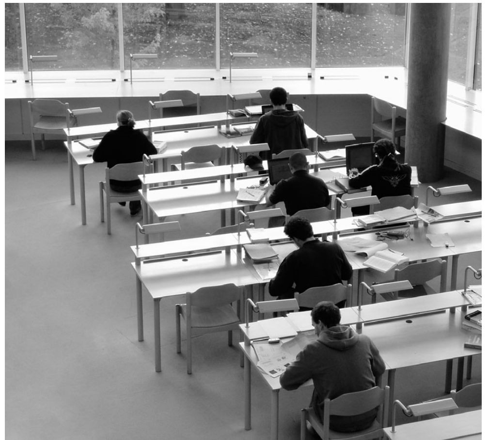
Haridus ei ole tänapäeval privileeg, vaid igapäevane õigus.

“Ei mäletagi täpselt, kuidas minul omal ajal see mõte tekkis,” mõtiskleb Astrit. “Eks see üks suur eneseületamine oli. Nagu öel-