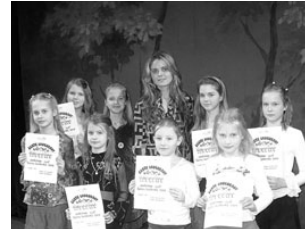
Rannus kuulutasid kuldnoke kevadet. Lk 5