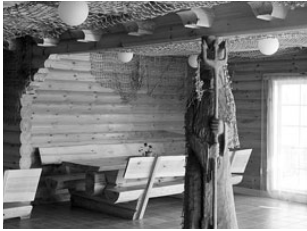
Vehendi hotell ootab taas suvepäevalisi ja pidulisi. Lk 3