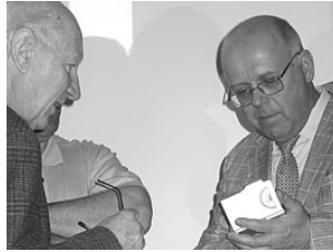
Energiasäästu konsultant kutsub rohkem tegelema energia säästmisega. Lk 4