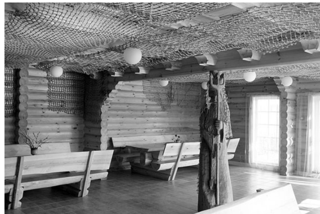
Avar saal on 80 ruutmeetrit suur.