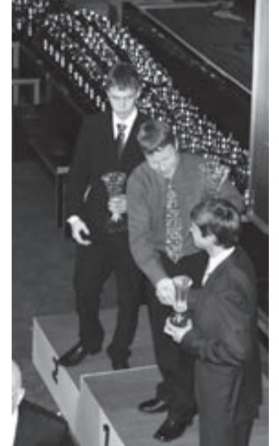
Toomas Kallasmaa on Eesti parim vormelisõitja.