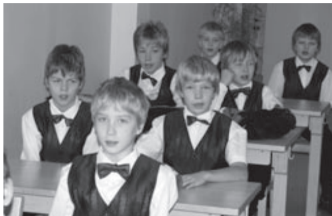
Laulupoisid on olnud alati publiku lemmikuks.

Ühisgümnaasiumi tütarlasteansambel, kes tänu oma heale ansamblitunnetusele, maitsekale esitusele ja puhtale intonatsioonile suutis edestada Jõgeva Gümnaasiumi poisteansambli. Jõgeva poistele jäi