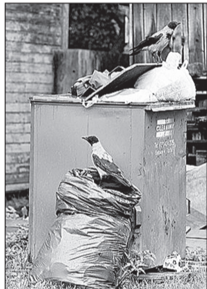
Juhtub ka seda, et prügiauto tulekuks ajab konteiner juba üle ääre.

Alates 1. märtsist toimub Türi vallas korraldatud segaolmejäätmete äravedu. Nagu ikka uue asja puhul, ei lähe kõik libedalt ja häireteta. Jäätmete veoga tegeleb Adelan Prügiveod OÜ. Ka neil on uute veoringide kokkupanemisega probleeme. Omajagu segadust on tekitanud asjaolu, et kodanike avalduste alusel on Türi