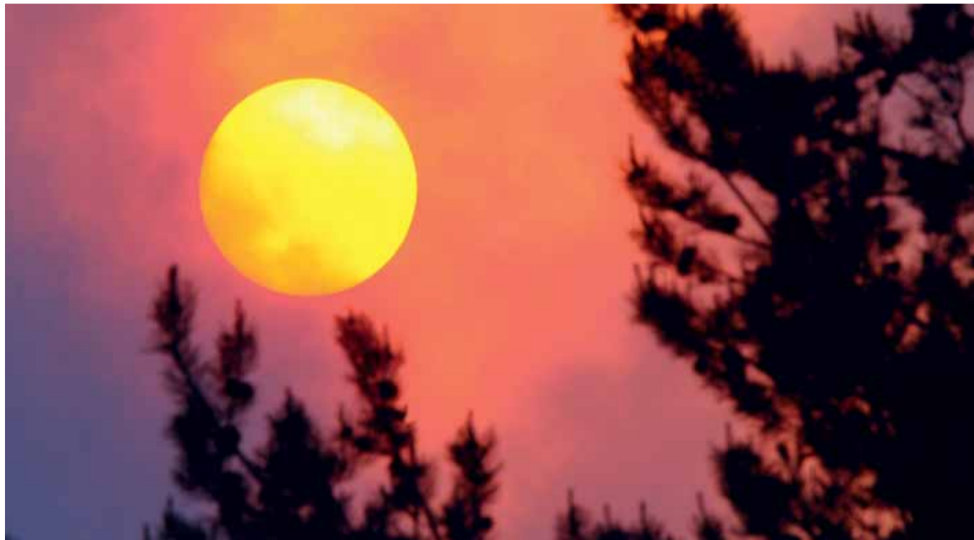
Keskkonnaministri poolt kavandatava riigimetsanduse ulja reformiga lubati väiksemat bürokraatiat ja rohkem inimesi metsa