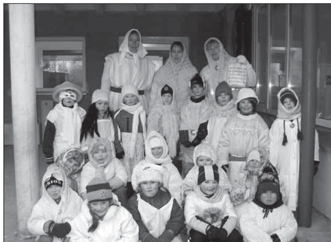
Väikesed ja suured kadrid.

Asusidki siis kadrisandid koduteele, kel hea meel koolist saadud kingituste, kel vallamajast antud maiustuste või hoopis