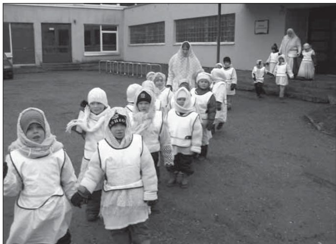
Kadrid teel koolimajast vallamajja.

vallavanem välja lugeda nii erinevaid vahvaid lugusid. Loodame, et kadride head soovid toovad vallamajarahvale nii karjale kosumist kui eelarvele sigivust!