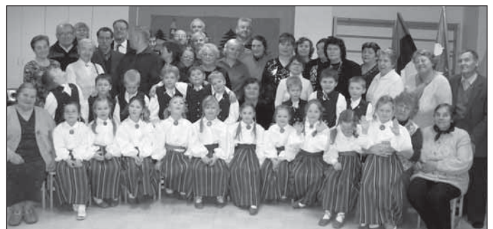
Vanavanemad ja lapselapsed.

Kohale oli tulnud 30 vanavanemat, 1 isa, 2 ema, kes kõik