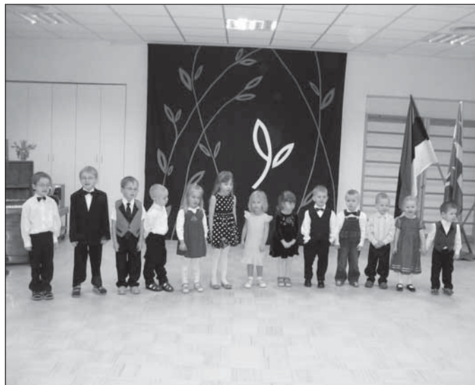
Vabariigi aastapäevale pühendatud aktus.

22. veebruaril toimus pidulik kontsert, kus esinesid kõik lasteaialapsed.