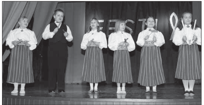
Laste folklooriring

Puhja Seltsimaja ei ole olnud kitsi oma isetegevuslaste eks- poneerimisega. Kõik suuremad ja väksemad esinejad saavad laval oma tähetundi nautida. Püsiva naeratuse toob saalisviibi- jate suule laste folklooriringi esinemine, nii siiras ja vahetu on selle väga noore generatsiooni etteaste.