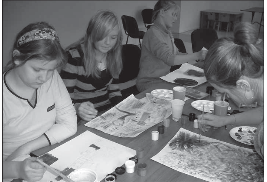
Joonistame Eestimaad, foto Airi Mahla.

Tunniajase töö tulemuseks oli hulk kauneid Eestimaad, völlumaid.