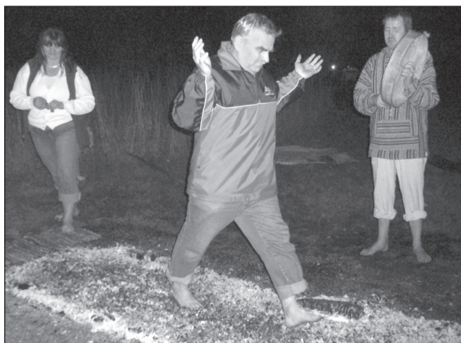
PEEDOSAARÕ KAISA PILDIT

Mõni samm ja rada joba otsan. Eski ütteri villi ei saa!