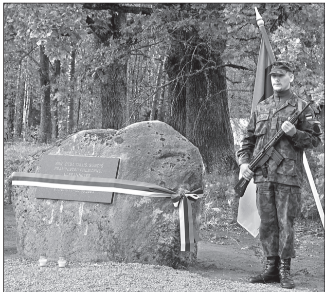
HARJU ÜLLE PILT

Vähämbält om ilostõ kõrda tettü, om Imbil hää miil. Illos om timä meelest ka riigimehele sünnüaastapääväs pant kivi – samast lähkült tuud maakivijõmakas.