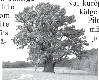
RAHMANI JANI PILT

Lähkümbät teedüst saa www.maavald.ee päält.