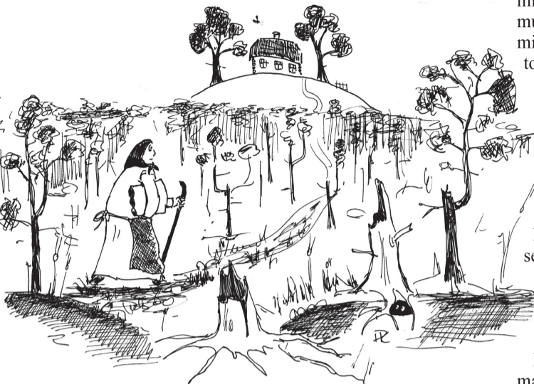
KOHA PRIIDU TSEHKENDÜS

Mõtsatüümehõ kõnõliva, et näide uma naasõ omma ka