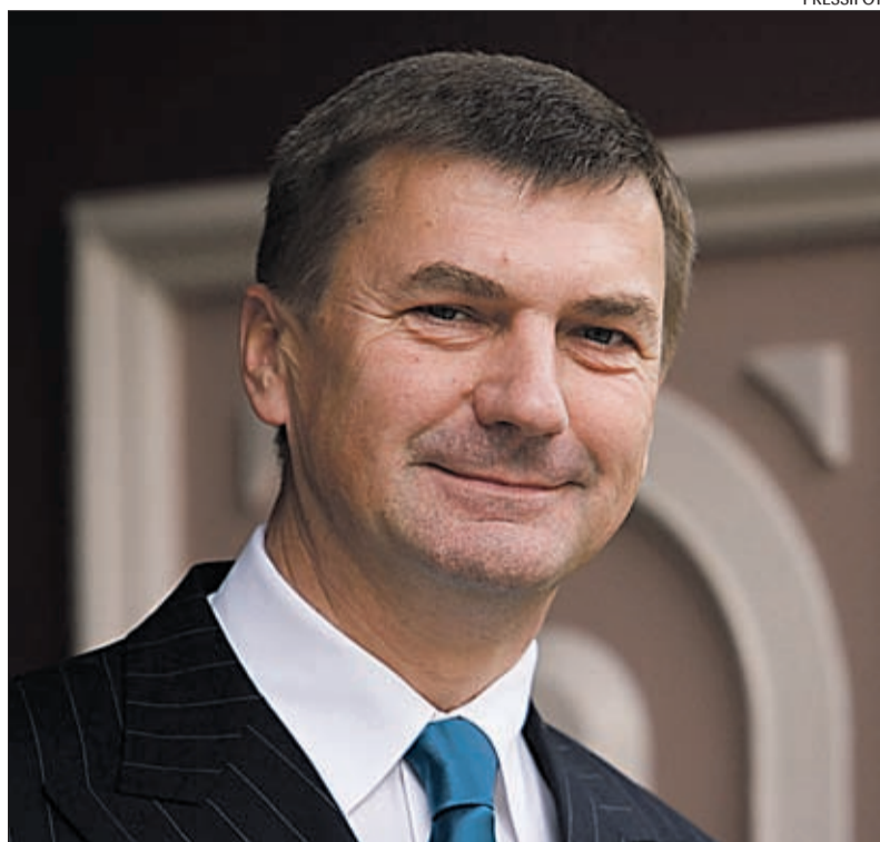
Peaminister Andrus Ansip käis Läänemaal.

Reformierakond seadis üldkoosolekul sihiks võita järgmise aasta kohalikud valimised Läänemaal, et suunata meie maakonna areng tõusuteele. Näeme Läänemaa inimestes väga suurt potentsiaali kogu maakonna tulevases arengus. Positiivne on see, et Reformierakonnaga liitus hiljuti 200. liige, mis näitab, et inimes-