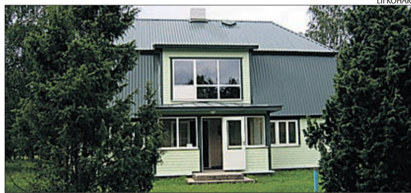
Seltside maja Luidjal.

Viimase paari aasta jooksul tehti majale kapitaalremont. Rahastajateks oli EL struktuurifondi Külade meede, Kohaliku Omaalgatuse Programm ja Hasartmängumaksunõukogu. Raha saadi SAPARDi programmist ja Hasartmängumaksu Nõukogule kirjuta-