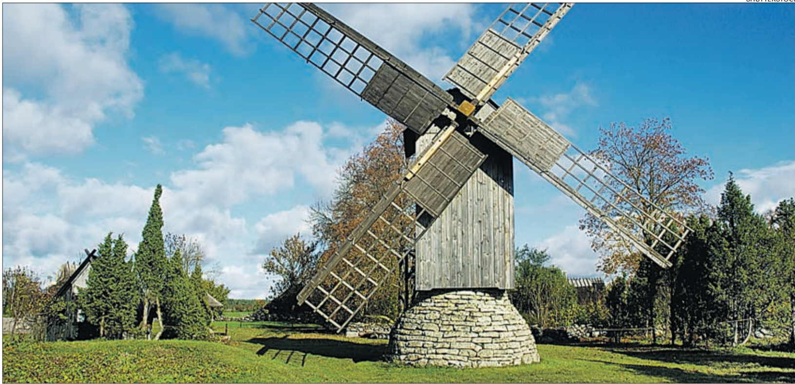
Saaremaa väärtus on omanäolisus.