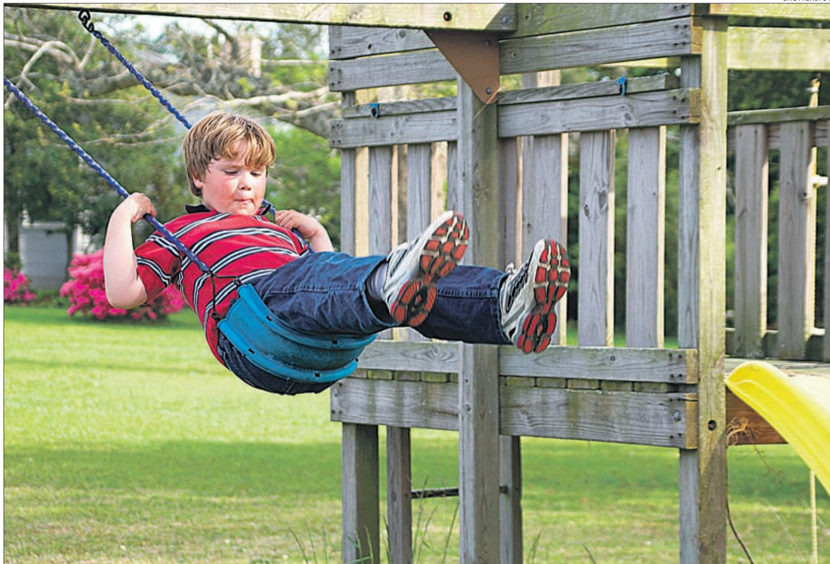
Laste mänguväljak peaks olema igas külas.