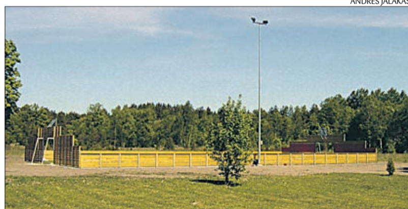
Pärnaku külas sellel suvel valminud spordiväljak.

Koostöö ja infovahetus Reformiera-konna poliitikutega valitsuses ja Ri-