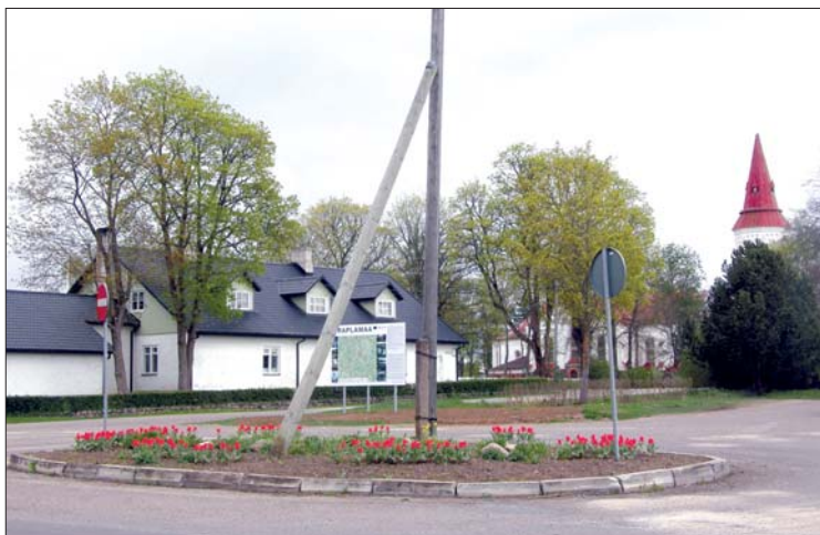
Hageri on kihelkonnapäeva ootel.

Head Hageri kihelkonna elanikud ja külalised! Kätte on jõudnud taas aeg kokku saada, et oma kodukohta tähtsaks pidada. Suvekuu algus on hästi sobiv aeg kihelkonnapäevade pidamiseks, sest kõik on alles ees. On soojust, on valgust. Tänavu möödub juba 20 aastat sellest ajast kui peeti peale nõukogude perioodi esimesed Hageri kihelkonnapäevad. Seda tehti toona Eesti Muinsuskaitse Seltsi eestvõttel ja küllap ka pisut väriseva südamega, sest Eesti ei olnud veel vaba. See oli aga algus - see oli sinimustvalgete lippude väljatoomise aeg, see oli suurte lootuste aeg. Just selliste "süütute" kihelkonnapäevade pidamise kaudu kasvas ka inimestes usk, et on võimalik midagi enam saavutada.