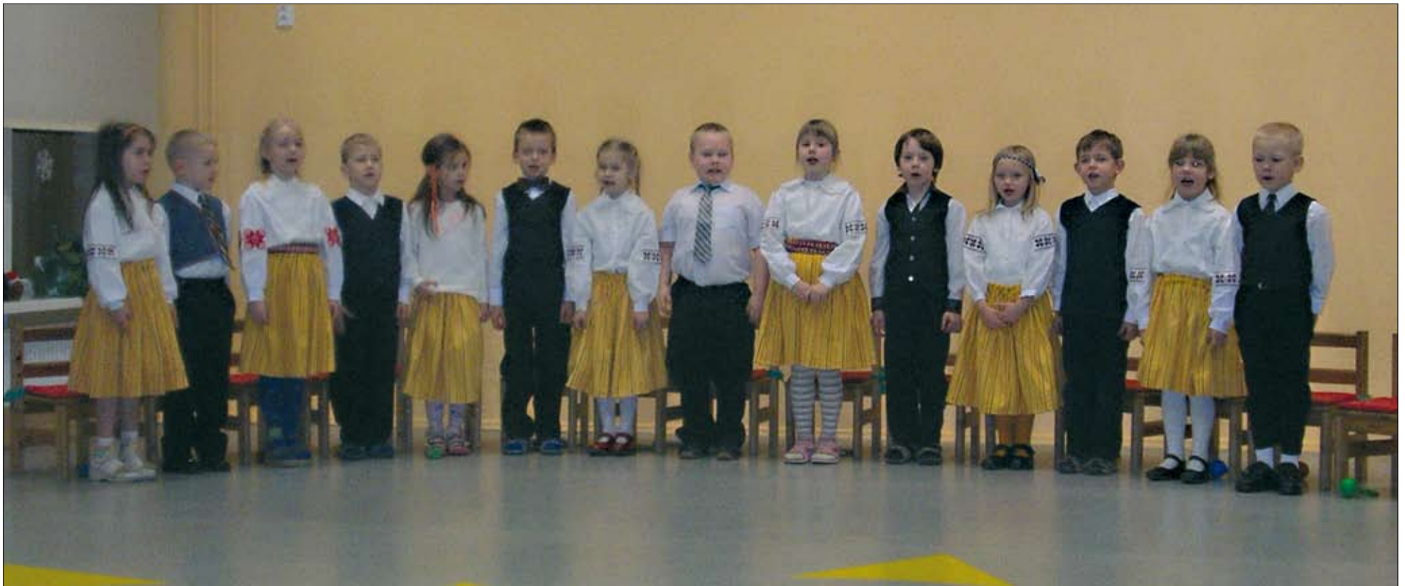
Pisipõnni lasteaia Päikesekiire rühma mudilased pidu pidmas.