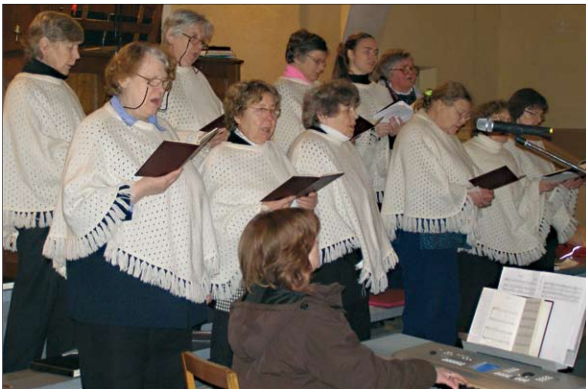
Tartu Rahu aastapäeva kontsert-aktusel Tapa Jakobi kirikus esines kirikukoor.

Peame tänagi tema sõnadega olema täiesti nõus. Kuigi Tartu rahu sõlmimise järel pole meile sugugi alati tundunud, et meie rahva saatuse lõplikult määratud on, võime seda täna süüsi rahu-