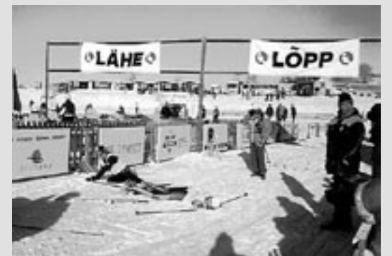
Hetk 1996. aasta teatesuusatamise finišist.