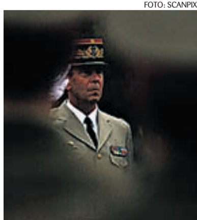
Kindral Henri Bentégeat

Kindral rääkis, et külastades Euroopa Liidu liikmesriike püüab ta aru saada kohaliku