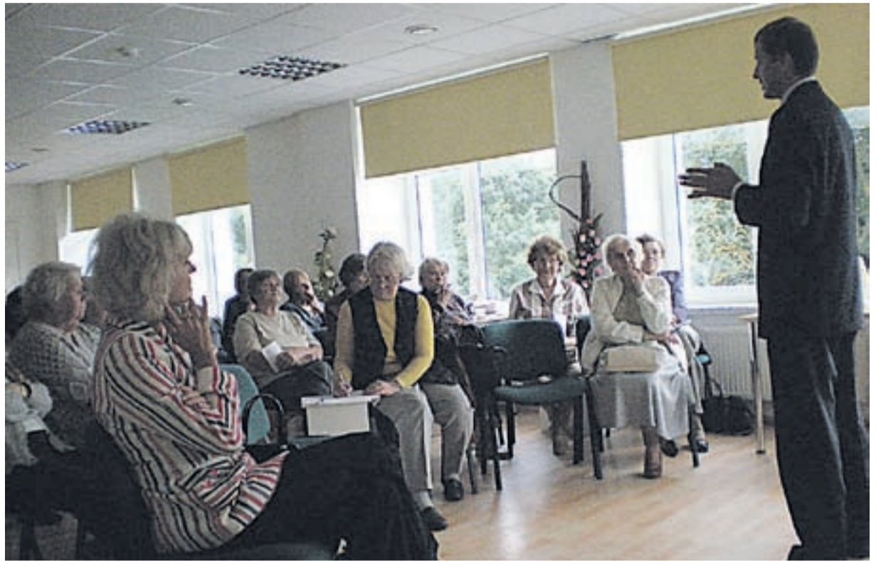
Rakvere eakad huvitasid kõik päevakajalised poliitilised küsimused.

Gruusia sündmuste valguses oldi murelikud, kas ei ähvarda Eestit mitte sama saatus. „Koalitsioonipartnerite kokkulepe edastab kindla sõnumi raskel ajal toime tulekuks ja asjad,