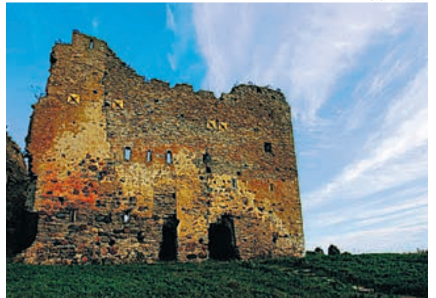
Mere äärde ehitatud Toole linnus on juba kolm sajandit seisnud varemets.

REFORMIERAKOND Tõnismägi 9 10119 TALLINN