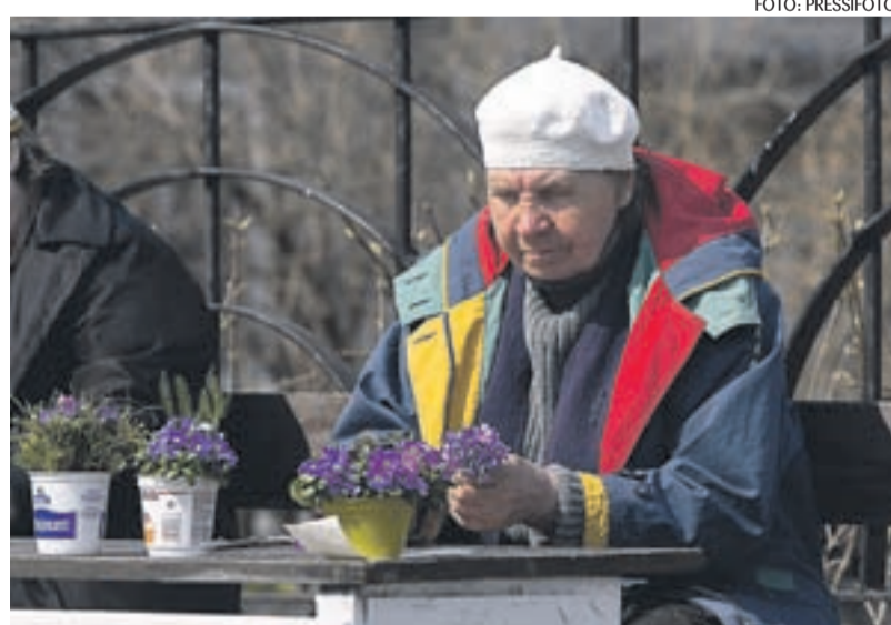
Paljud eakad soovivad ka pensionipõlves tööl käia või ettevõtlusega tegeleda.

Pensioni võib lasta kanda ka pangarvele. Viimasel juhul tuleb muidugi võtta ka pangakaart. Pangast raha võtmiseks võib juba ise vabalt päeva valida. „Pangakaardiga saab maksta üha rohkemates kohtades,” kirjutab