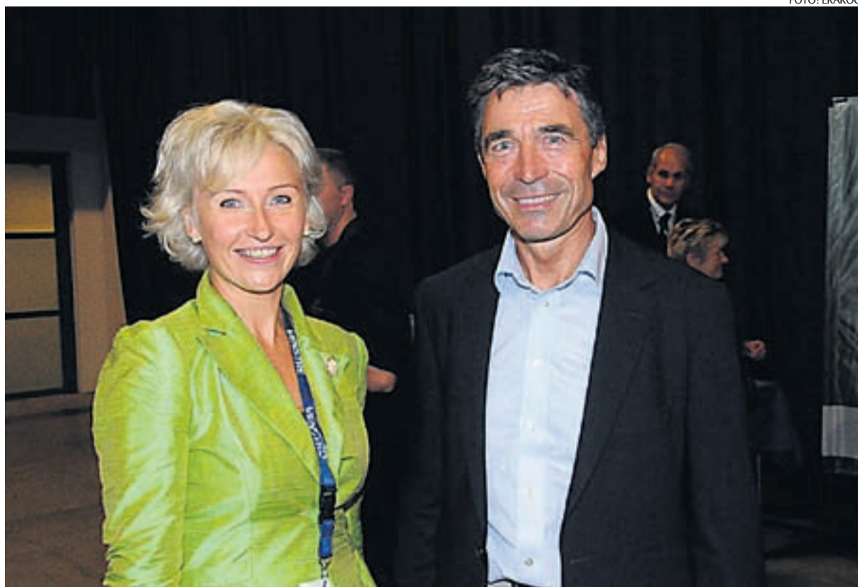
Kristiina Ojuland koos Taani peaministri Anders Fogh Rasmusseniga.

Kristiina Ojuland esines foorumi avamisel kõnega. „Foorumi avamisel oli meeldiv kuulda rahvusvaheliste organisatsioonide kiidusõnu Eesti arengu aadressil, meenutati kadunud president Lennart Meri osa Crans Montana Foorumi kujunemisloos,“ märkis Ojuland.