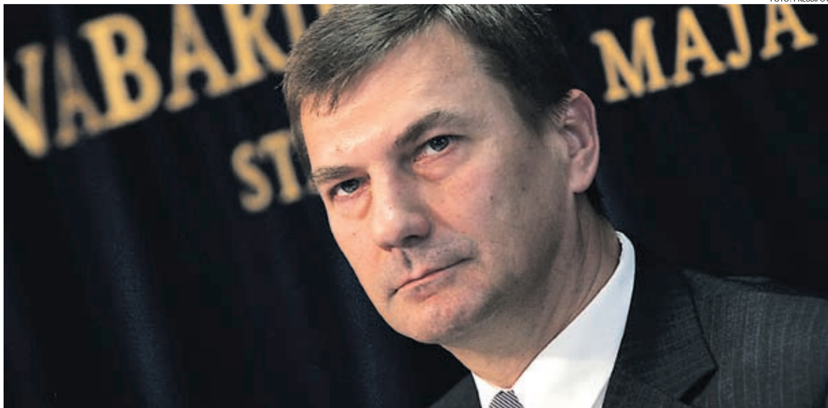
Andrus Ansip soovib ettevõtjatel orienteeruda stabiilsematele turgudele, kui poliitilistest riskidest kubisev Venemaa oma.