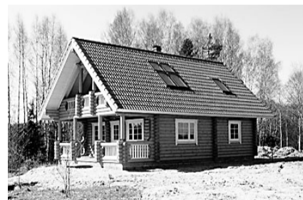
Otepää vallas pakutav palkmaja piirneb Elva jõega. Veekogu äärsed kinnistud on Otepääl läbi aegade huviojektiks olnud.

2toalised järelturu korterid, 450 000 - 800 000 krooni. 3toalised järelturu korterid, 650 000 - 900 000 krooni. Vanemad majad, 1 200 000 - 2 300 000 krooni. Uuemad majad, alates 2 800 000 krooni. Maamajad, alates 1 000 000 krooni. Talukohad, 250 000 - 1 500 000 krooni. Heas seisukorras talukohad, talu juurde kuulub suurem maatükk, alates 1 600 000 kroonist.