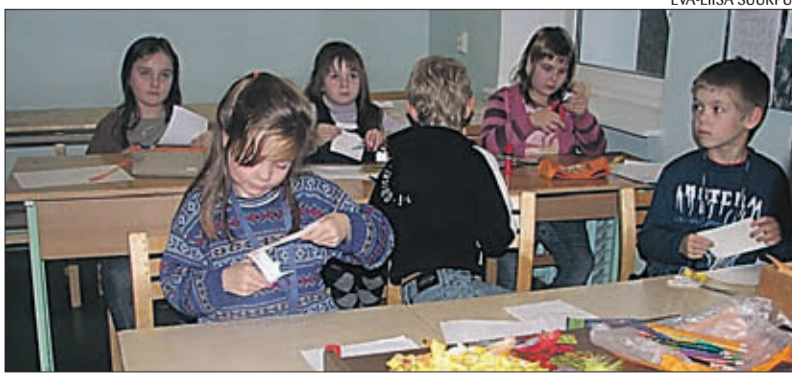
Lastele jõulukaartide meisterdamine meeldis.

T ahtsime tuletada meelde nii lastele kui vanematele, et jõulude ajal tuleks meeles pidada oma lähedasi ning kõige ilusam ja südantsoo- jendavam viis selleks ongi just ise valmistatud kaart, sest see tuleb ot- se südamest ning kahtlemata rõõ-