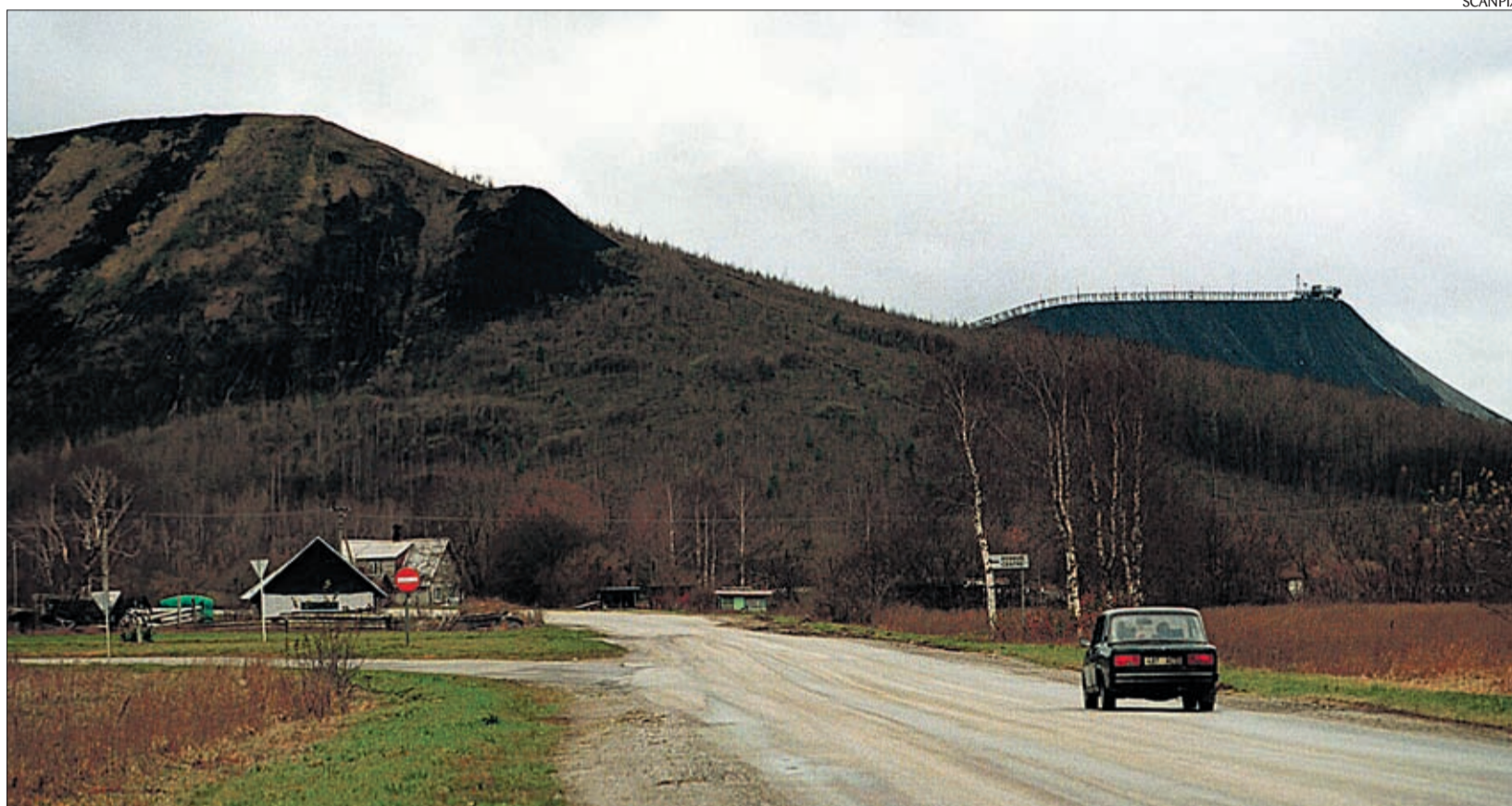
Kiviõli linnas kõrgub kaks tuhamäge.