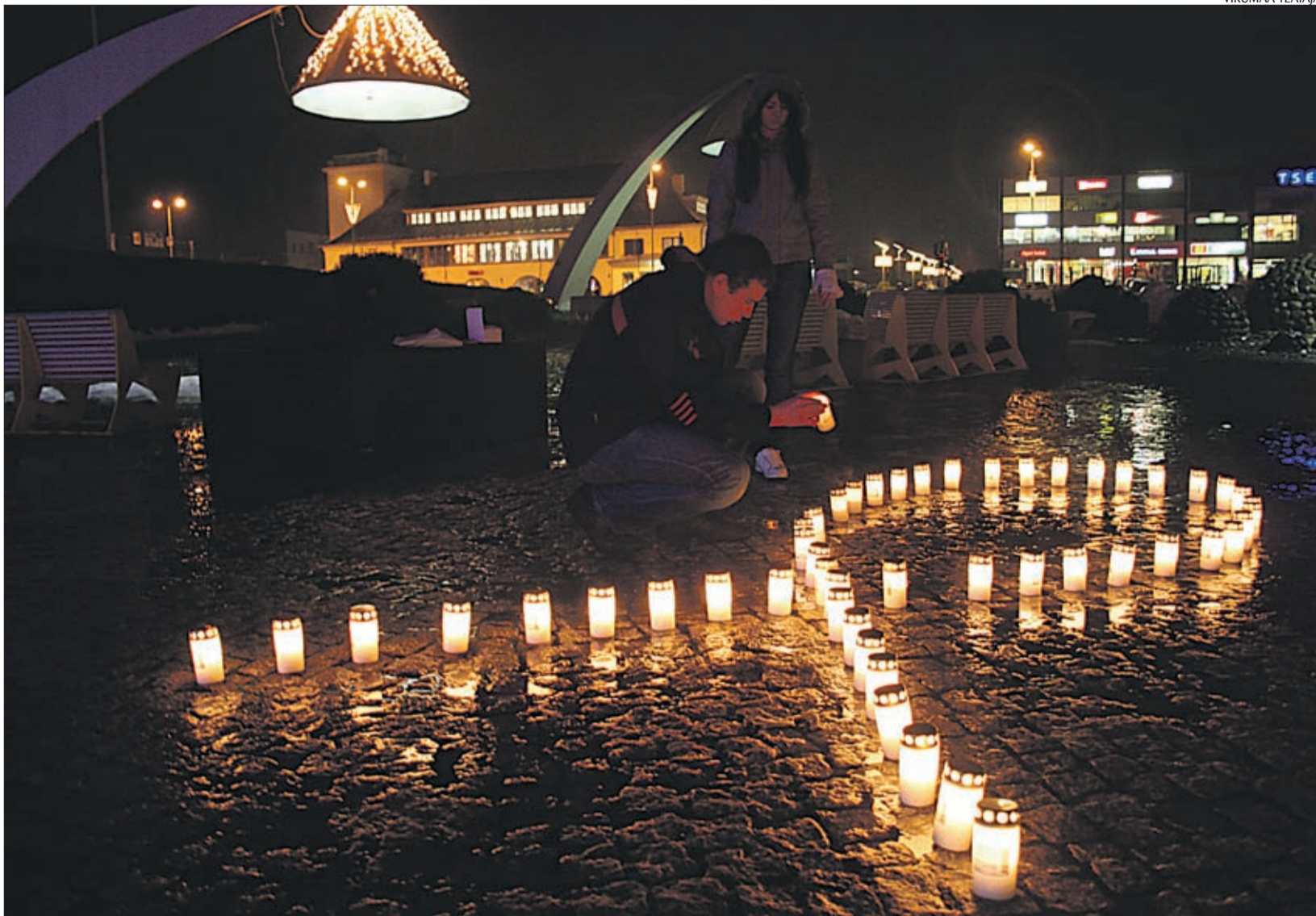
AIDSi ohvrite mälestuseks süüdati Rakveres küünlad.