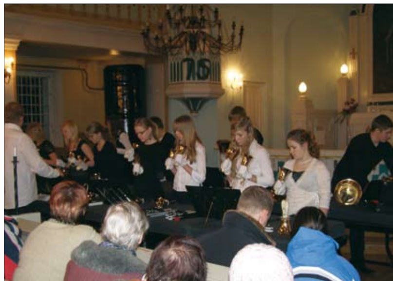
ARSISE käsikellade ansambel esines Tapa Jakobi kiriku sünnipäevaliste.

Ja pole su külmas linnas siis midagi Jõuluist.