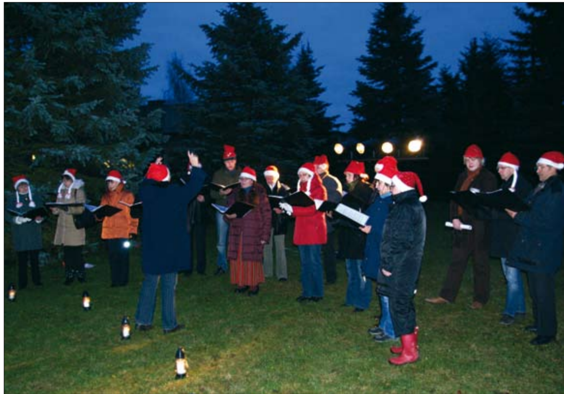
Lehtse kammerkoor kuulutas kaunite jõululauludega teise adventinädala algust.