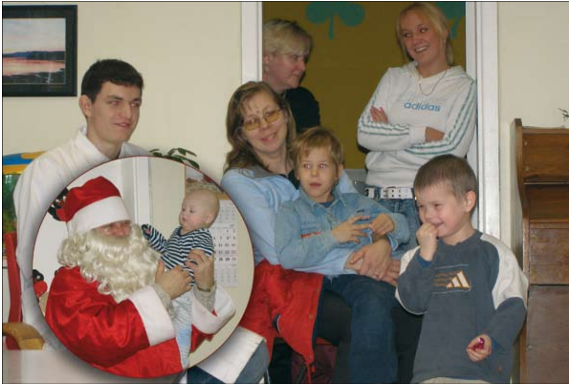
MTÜ Kesk-Norra Eesti Ühingu Tapa Laste- ja Noortekodu kasvandikud tundsid rõõmu jõuluvana külaskäigust.