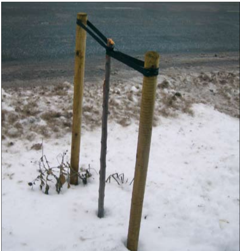
Sellised kurvad ja masendust tekitavad tüükad jäid järele pärast vandaalide rünnakut Ülesõidu tänava ilusti kasvama läinud noortest puudest.