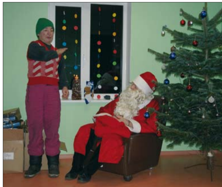
Selle nädala esmaspäeval käis jõuluvana salmiuskust kontrollimas ja kingitusi jagamas MTÜ-s Jeeriko.