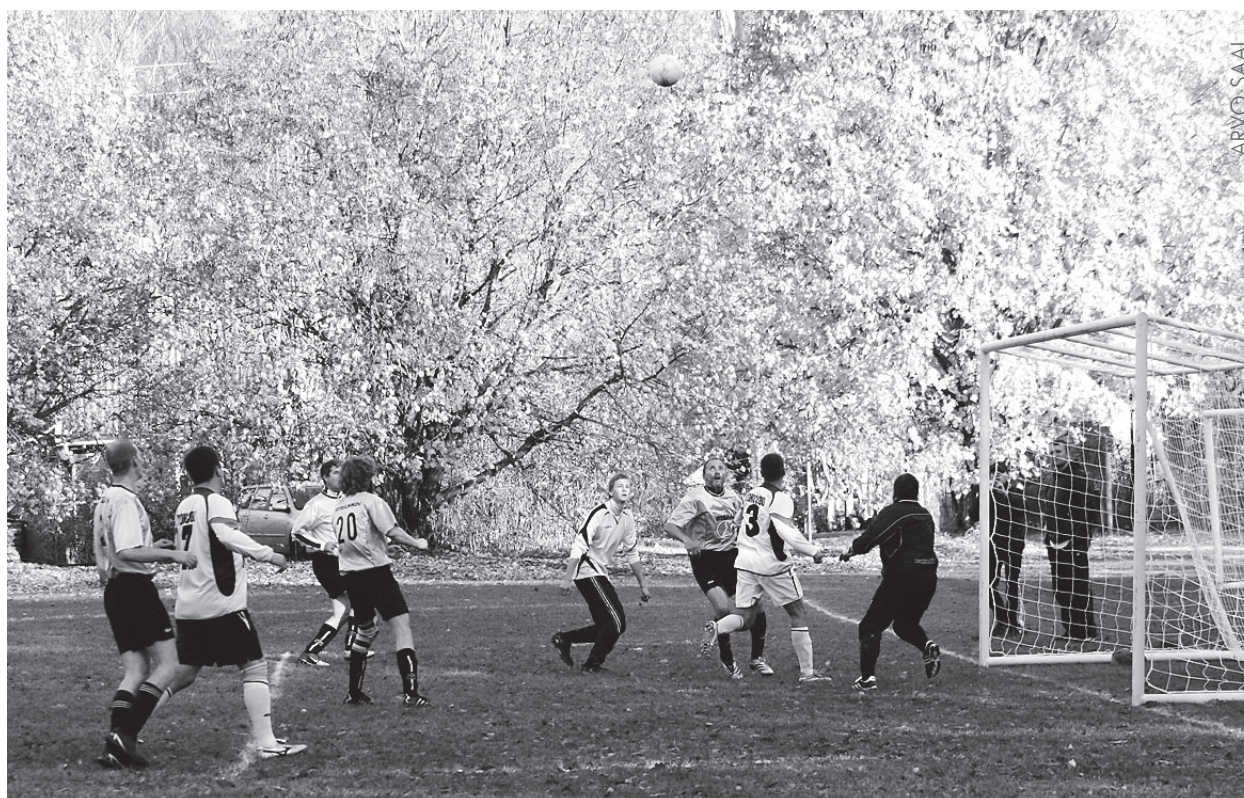
Üks otepäälaste järjekordne rünnak. Pall sellest Toksovo meeskonna väravasse siiski ei läinud.

Mängu käiku mõjutas vaid ühe kohtuniku kasutamine, kes lihtsalt ei suutnud kõike väljakul toimuvat jälgida. Kuna arusaamatuid otsuseid tehti mõlema poole mängijate suhtes, leppisid jalgpallurid olukor-