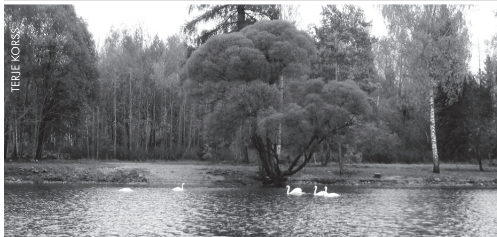
Eelmisel aastal korraldatud Hellenurme paisjärv meelitas kohale luigid.