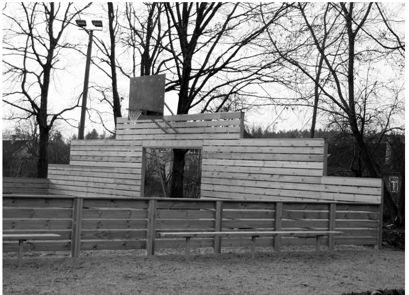
Vastvalminud spordiväljakul saab palli mängida ka õhtuhämaruses tulede valgel.