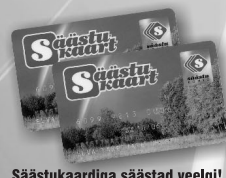
Säästukaardiga säästad veelgi!