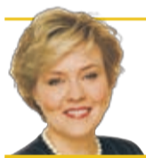
Maret Maripuu Sotsiaalminister

Sotsiaalminister Maret Maripuu selgitab, miks on tööõiguse reform Eestis nii oluline.