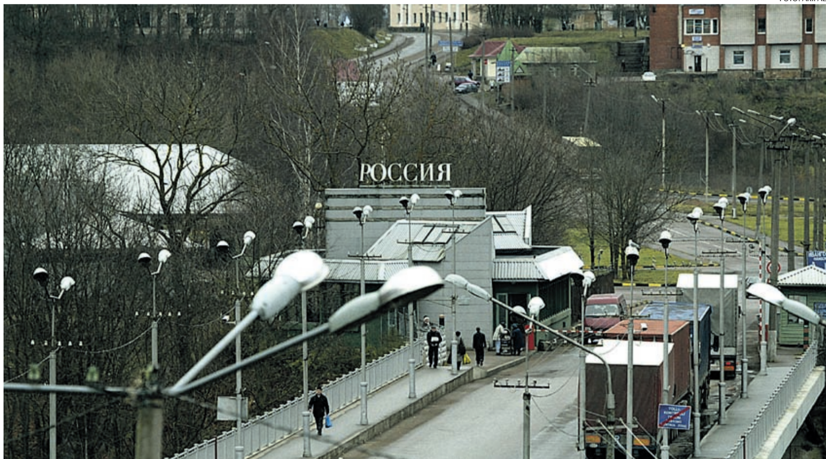
Eesti-Vene piir Narvas on alates detsembrist esimene, kus Portugalist Euroopa reisi alustanud passi näitama peab.