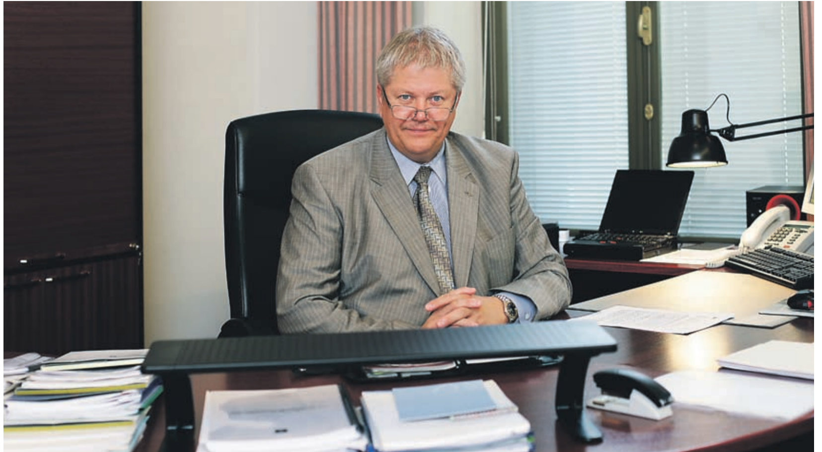
Justiitsminister Rein Langi hinnangul on uus Viru vangla vaieldamatult üks tänapäevasemaid kogu Euroopas.