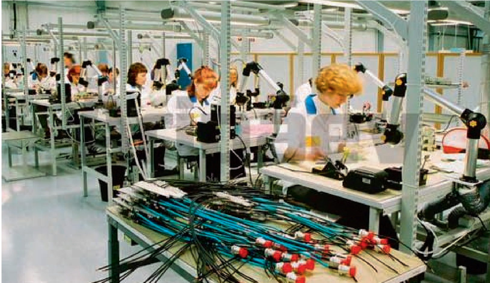
Uus töölepinguseadus, mis toetab töötajate enesetäiendamist, peabaitama kaasa teadmismahuka majanduse arengule. Pildil Elcoteqi vabrik Tallinnas.