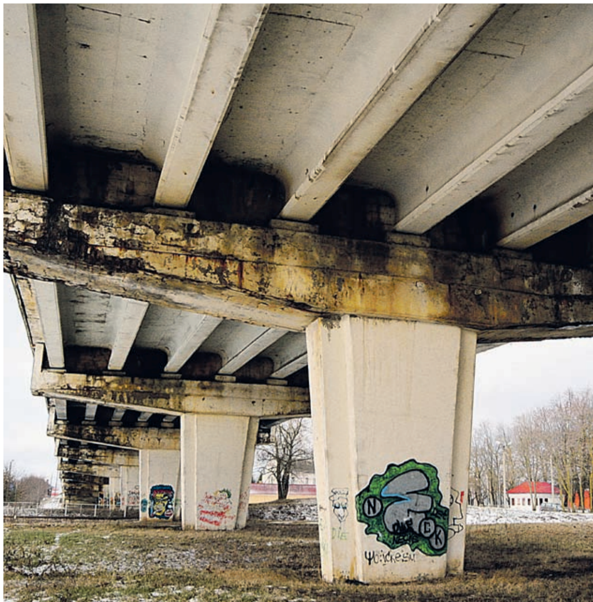
Jõhvi viadukt on juba aastaid ohtlik linnaosi lahutav müür, mis tuleks asendada kaasaegsema liikluslahendusega.

Kohaliku ajakirjanduse andmetel on Jõhvi võimud majasiseselt sirgeks väinud, et parim lahendus uue liiklussõlmi väljatöötamisel oleks raudteelune tunnel. Põhiargumendiks asjaolu, et praegune viadukt mõjub südalinna lõhkuva monstrumina, mis takistab linna lõunasuunalist arengut. Kui projektorija ja ministerium räägivad kokku-