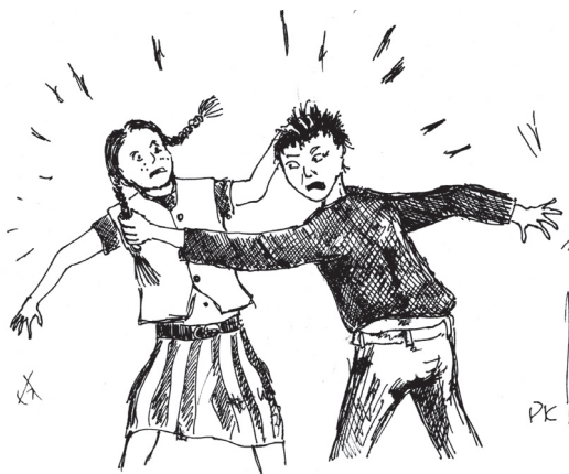
KOHA PRIIDU TSEHKENDÜS