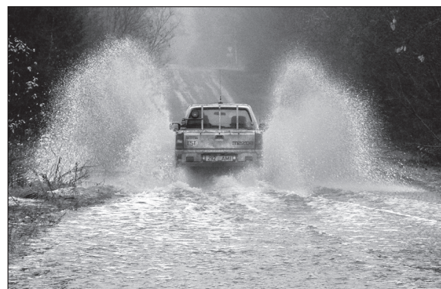
Vingõmba massina umanik julgusi iks läbi sõita kah.

Tä selef, et ku kobras koskil vett paisutas ja inemine om tuuga hädän, sis või julgõhe