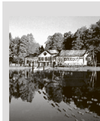
Röömsa kohtumiseni! Info 7668 555, pyha.kool@mail.ee