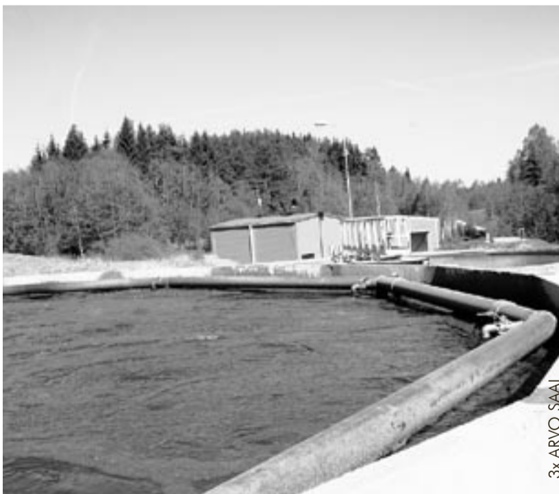
3x ARVO SAAL

Tänavu hakkavad veevärgi töötajad kirjutama projekti, et leida raha keskkatlamaja rekonstrueerimiseks. Senine ei rahulda enam, sest tarbijaid on tulnud juurde ja uusi suuri