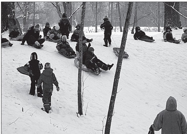
• Veebruarikuu pakane ei takistanud lapsi vastlapäeval lustimast.