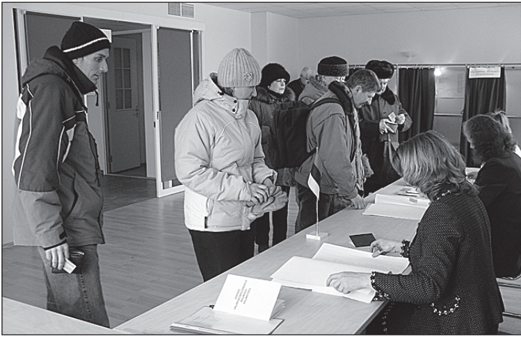
• Esimesed valijad jaoskonnas.