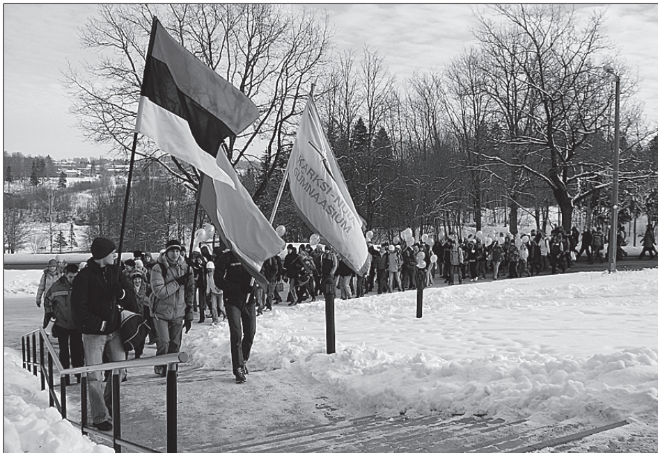
• Karksi-Nuia Gümnaasium tuli valla arengukonverentsile ühtse kolonnina, lipud ees.