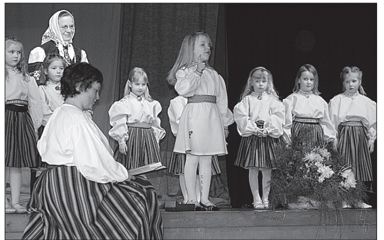
• 24. veebruaril tähistati vallas pidulikult vabariigi aastapäeva. Kontserdil esinesid meie oma valla taidlejad. Kava pani kokku Linda-Maria Arro.