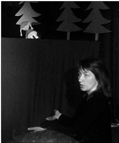
● Hetk Punamütsikese etenduselt.