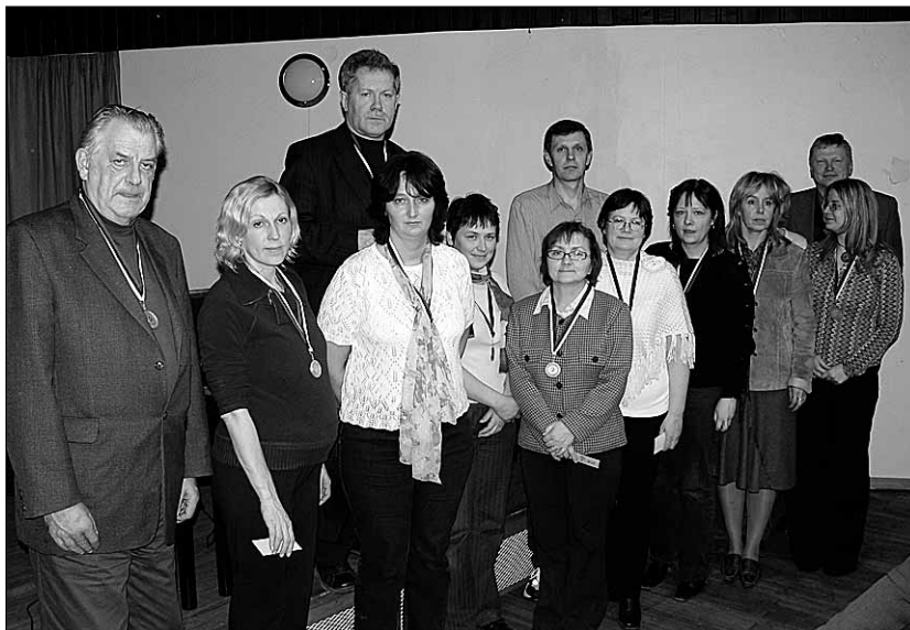
● Mälumängijatel oli 28. märtsil selle aasta viimane kohtumine.

Aastakokkuvõtte tulemusena riputati kuldne medal kaela üldvõitjale, kelleks osutus 121 punktiga "VÜKK-