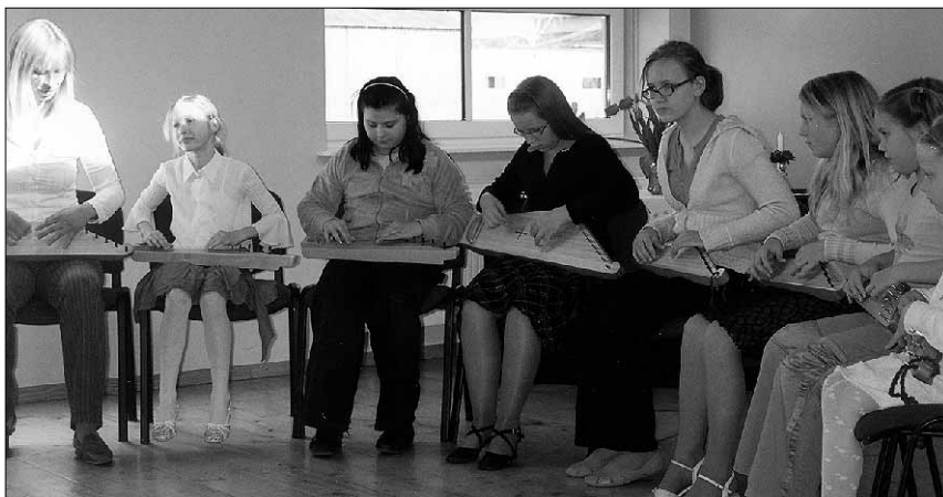
● Uusna külamajas esinevad Viiratsi kanneldajad.

Tänassilmas peeti valla sünnipäeva nädal varem, 28. aprillil. Öhtu kandis nimetust „Tuhkatriinu ball“, mistõttu kanti vastavaid kostüüme ja tantsiti ballitantse. Tänessilma rahvamaja näitering "Pupu-Jukud" astus üles etendusega "Tuhkatriinu", ballitantse esitasid nais-