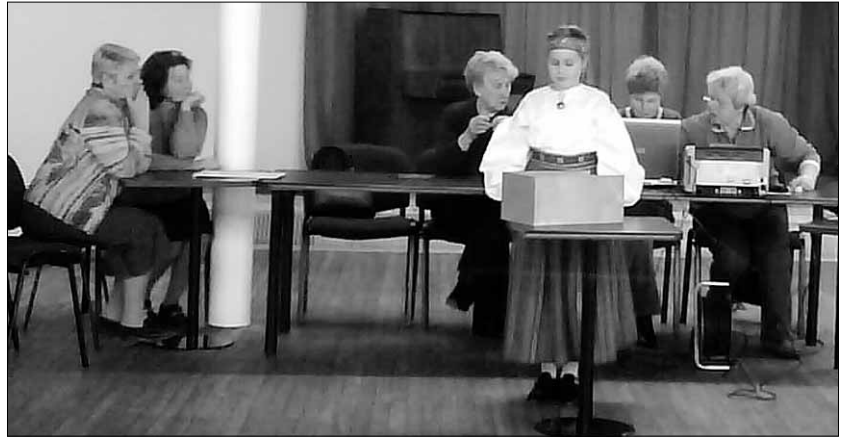
● Käib ehituskruntide loosimine.