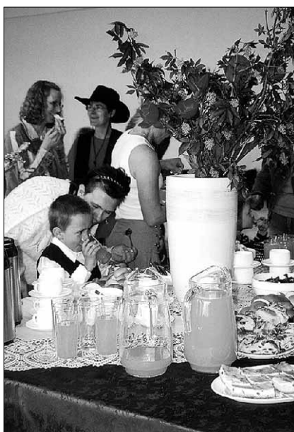
● Ühisest peolauast said osa nii esinejad kui külalised.