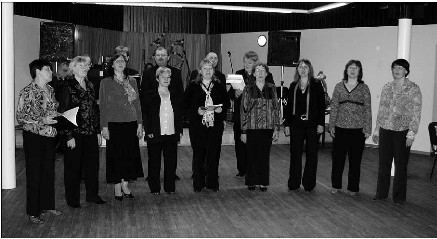
● “Sind tervitan” — esineb lauluansambel “Virvas”.