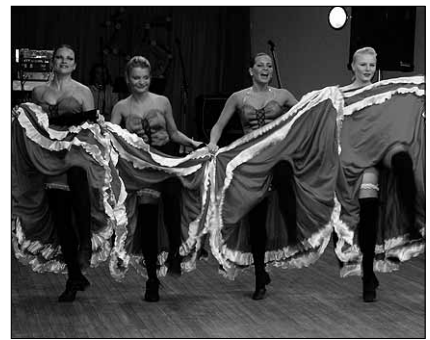
● Esineb tantsugrupp “Fayola”.