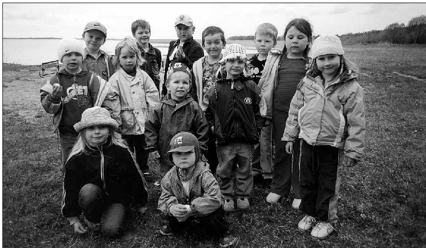
● Uusna lapsed Vaibla rannas.