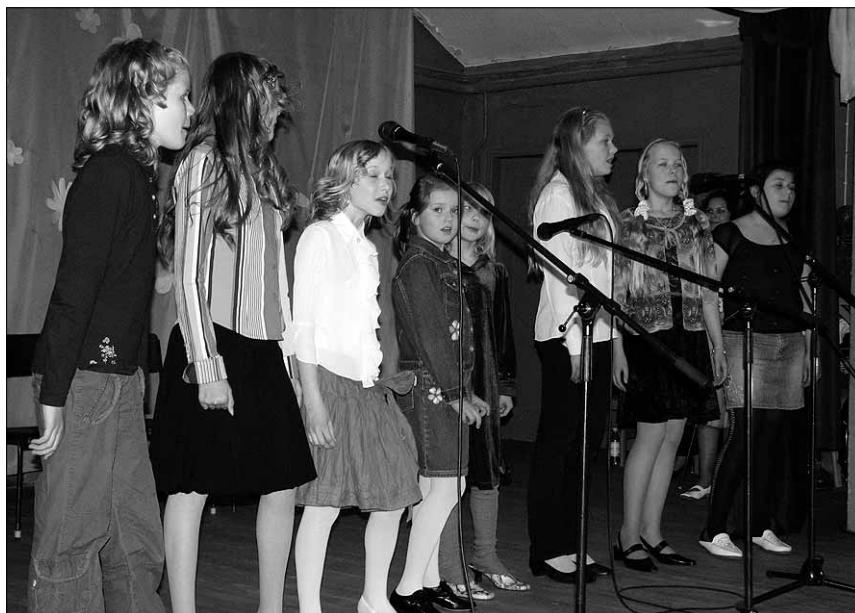
● Uusna lapsed esinemas emadepäeva kontserdil.