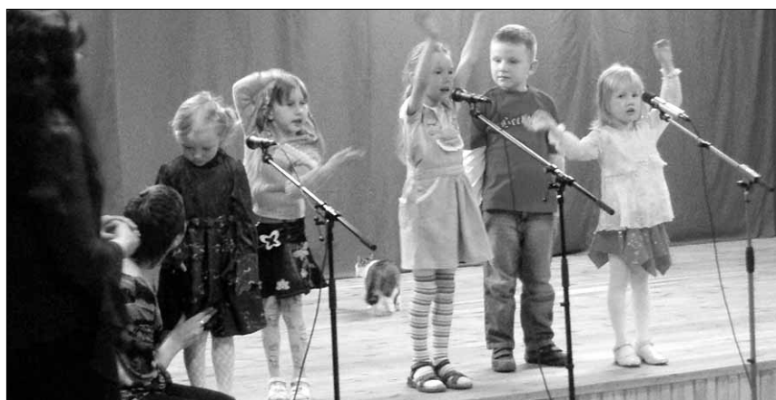
● Esinevad Tänassilma lapsed.