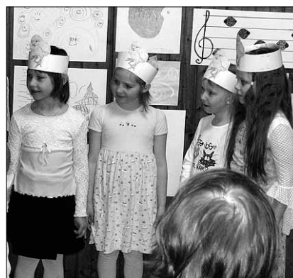
● Püünel on mudilaste mängutoa liikmed – Viiratsi rahvamaja kõige väiksemad isetegevuslased.