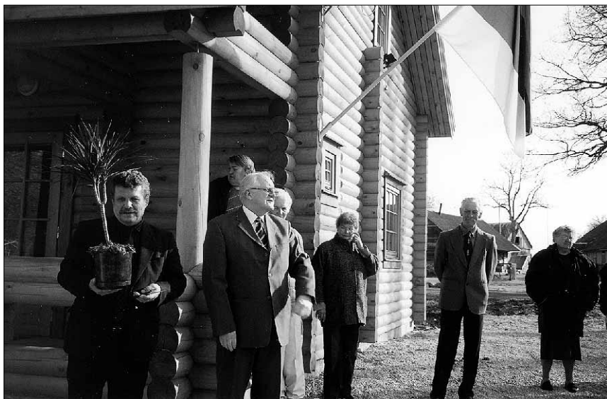
● Hetk Valma infopunkti avamiselt 5. mail.

rahatantsurühm "Kaheksakand" ja eakate tantsuansambel "Röömsameelsed". Lisaks oma maja taidluskollektiividele esinesid võistlustantsuklubi "Linavästrik" noored tantsijad.