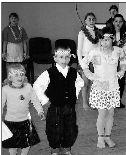
● Emadepäeva kava kandis nime "Eidekene".