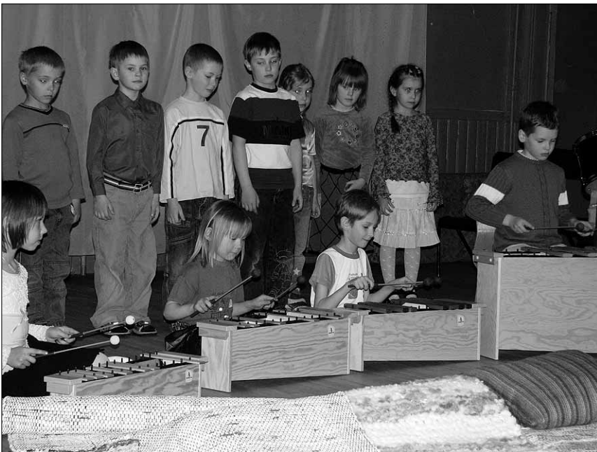
● 4. mail avati Viiratsi rahvamajas käsitööringi näitus, mille muutsid pidulikuks laste etteasted.