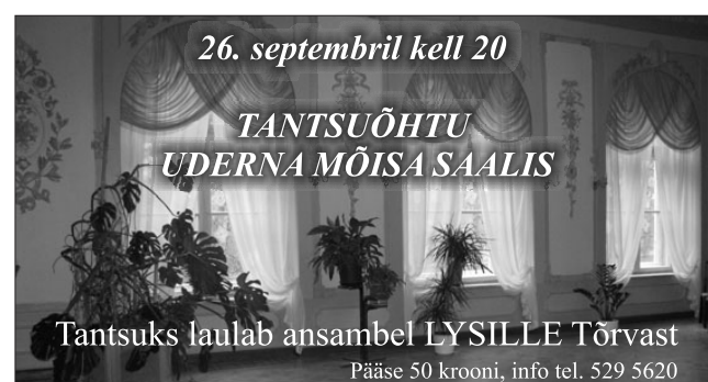
Tantsuks laulab ansambel LYSILLE Tõrvast Pääse 50 krooni, info tel. 529 5620