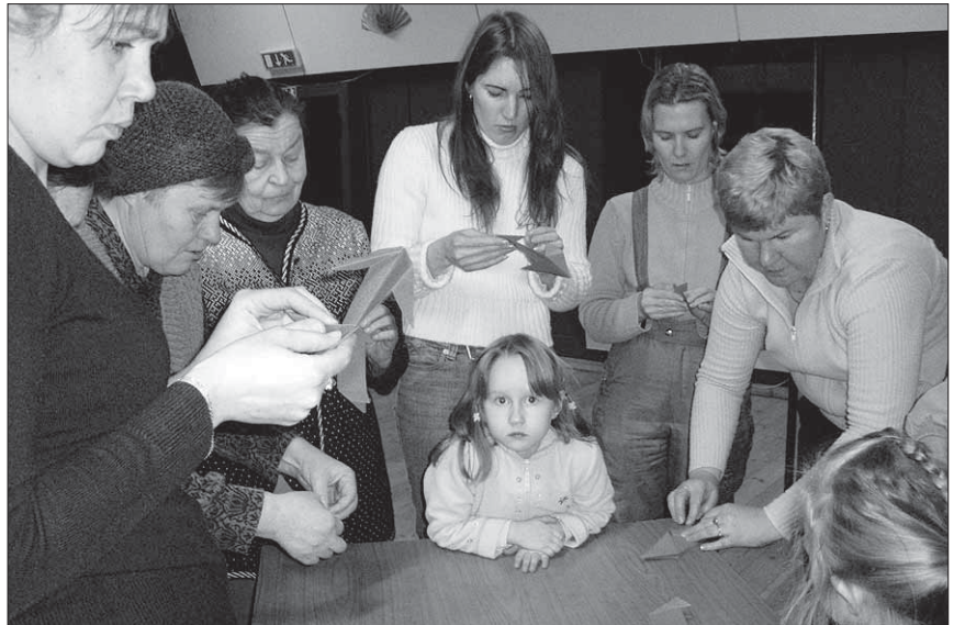
● Kõik käed teevad tööd.

kokkupanemises. Veel oli võimalik meis- terdada endale pulganukk-siga, voldi- tud siga ja muud. Kõigile osavõtjatele ja-