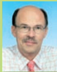
Head saabuvat linna sünnipäeva soovides

Kesklinna ilmet mõjutavaid ehitisi on lähiajal Jõgevale kerkinemas veelgi. Kirjutaksin siinkohal lahti jalakäijate raudteeületusekoha teema. Linnavalitsuse tellimisel mõõdunud aastal valminud eskiisprojektid, mis pakkusid raudtee ületamise võimalusteks tunneli või viadukti rajamist, ei leidnud paraku paljude linnaelanike poolt heakskiitu. Nii mõõdunud aastal kultuurikeskuses toimunud projektide tutvustamisel kui ka viimasel arutelul nädalapäevad tagasi oli elanike sooviks näha tulevikus Jõgeval eelkõige ühetasandilist raudteeülekäiku. Arutelust osavõtjad ei soovinud raudteed ületades laskuda ei maa alla ega ronida kõrgustesse. Eesti Raudtee oli samas valmis meile ehitama kaetud külgede ja katusega ning kaldtee, treppide ja liftiga viadukti. Sel moel oleks olnud võimalik viia jalakäijad ning raske rööba transport eri tasanditele. Demokraatliku arutelu tulemusena ja arvestades rahva soove, rajatakse siiski veel sel aastal ühetasandilised ülekäigud. Töö käigus korrastatakse kaks olemasolevat ülekäiku ning rajatakse täiendavalt 170 m kesklinna ülekäigust Tallinna poole, raudteeperrooni lõppu, veel üks ülekäik. Kõik kolm ülekäiku ühendatakse omavahel laia kergliiklusteedega, pikendades teed selle aasta lõpul valmiva bussijaamanihooneni.