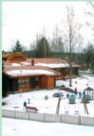
Keuruus on mõnusad ja väikesed lasteaiaid.