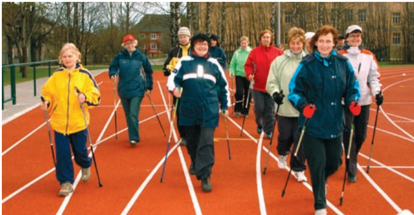
Jõgeva staadionil toimunud tervisepäev tõi kokku hulgaliselt erinevas vanuses elurõõmsaid inimesi.

Info: Aimur Säärts Tel: 776 0090 www.sarkasport.ee/pargijooks