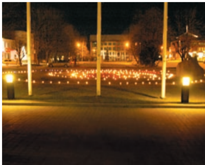
Öösel säras kesklinnas naistsantsijate poolt süüdatud südametuli.