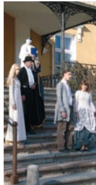
Külaliste vastuvõtt Kuremaa lossis.