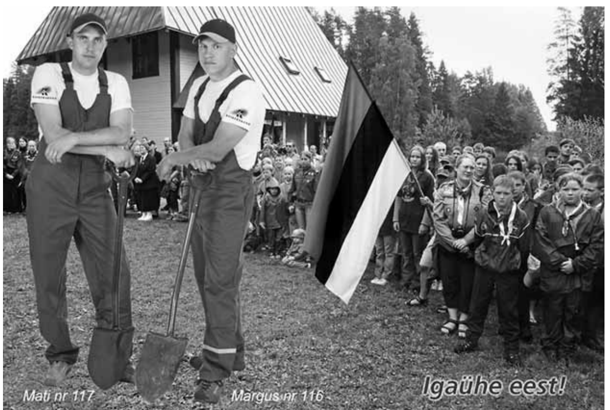
Mati nr 117