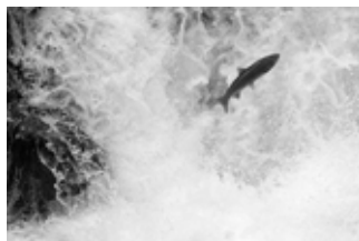
Lõhe oma loomulikus elukeskkonnas

Esimene pais asub 10 km kaugusel jõe suudmest Joaveskil. 50% koelmualadest asuvad ülalpool Joaveski paisu. Lisaks kättesaamatutele koelmualadele on probleemiks hüdroloogiline režiim allpool Joaveski paisu.