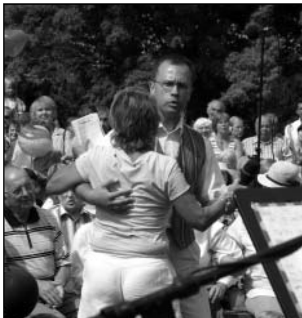
Tantsi, tantsi, keeruta, keeruta...