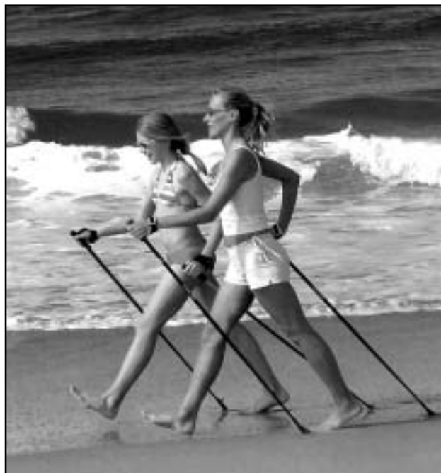
Keplikönnil on mõnus kaaslasega vestelda.