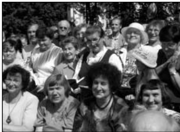
Sõbrannad kontserti nautimas.