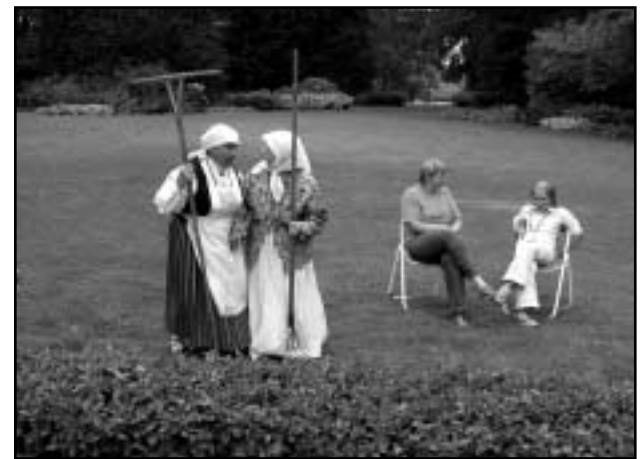
Maali ja Juuli suurim soov – tehke rohkem lapsi!