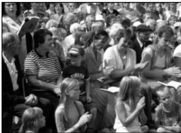
Meie laulame kõik koos.