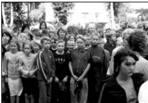
Jälle koos on koolisõbrad.

Ruusa Põhikooli ja Naha Algkooli esimesse klassi astunud laste nimed trükitakse ära septembrikuu Rõpina Rahvalehes.