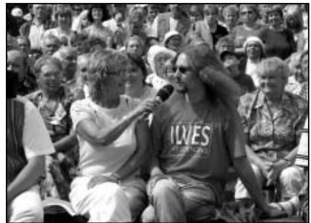
Kas veel mõni Ilves võib saada presidendiks? Ja jaa, minu ema ja minu vend ka.