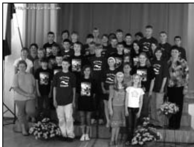
Juunikuise väli-eestlaste laagri lapsed koos võõrustajatega.