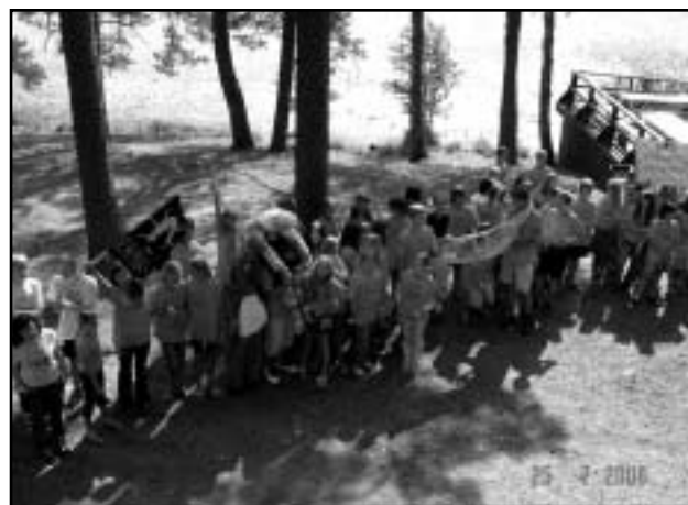
PÕM 2006 kokkutuleku avamine Saarljärvel.