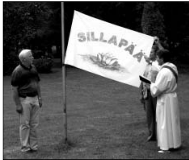
Lipu õnnistamine enne heiskamist.

Kõht tühi – mis muud kui mulgipudrule. Küll oli maitsev! Hiljem