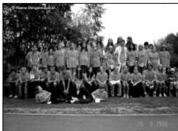
Saime käte malevasärgid ja oleme täieõiguslikud PÕMI liikmed.