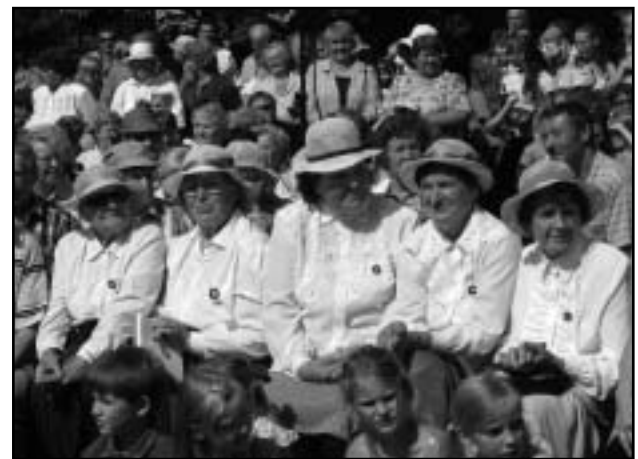
Sinililled – kübaradaamid.