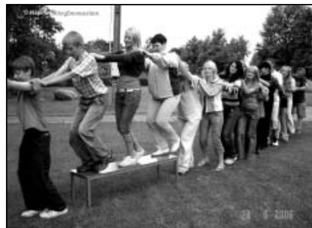
Sõbra õlg on toeks takistuste ületamisel.