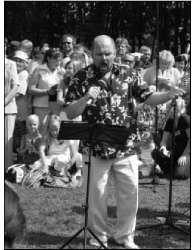
Kukki värises kirikutornis, kui Jassi laulis.