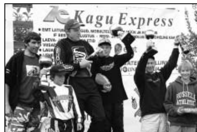
Isad – Pojad võitjate autasustamine.