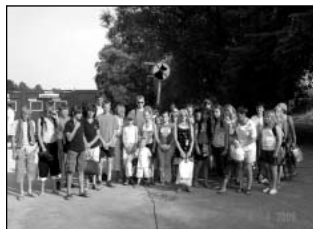
Pärnu rannas oli mõnus, aga ees ootab kodutee.