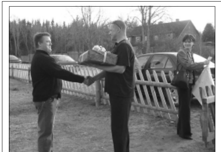
■ Aravusele on jõudnud Ivri pere.