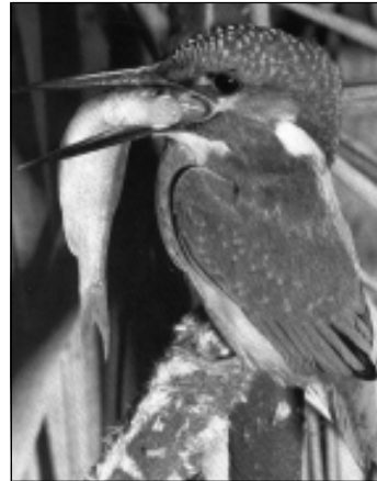
■ Mõnes kalakasvanduses olla saksa turistid sillal olnud, naha meetri pealt Eisvogelit .

Aitäh, lugupeetud esimees! Head kolleegid! Tegemist on väga olulise ja väga tömahuka eelnõuga, siin on nii ministeerium kui ka komisjon ilmselt väga palju tööd teinud. Mul on kahju, et mõnesse vähemtähtsasse asjasse on ilmselt suhtunud üsna pealiskaudselt. Jutt ongi nendest samast kahest muudatusettepanekust, 11 ja 12, mis oleksid pidanud või võimaldanud, - aga nad võimaldavad seda ka veel praegu, kui hääletamine nii otustab -, lahendada kalakasvatatajate probleemid. Asi on selles, et praegu § 61 käsitleb loomade tekitatud kahju hüvitamist ja hüvitise maksmist, ta käsitleb ainult hallhülge ja viiherhülge poolt kutseliste kalurite tekitatud kahju ning rändel olevate sookurgede, hanede ja laglede poolt tekitatud kahju põllumehele. Aga praegu hakkab Eestis järjest rohkem hoogu saama kalakasvatus ja kalaturism. Me oleme ise kõik juba aru saanud, et ainult põllumajandusega maal väga ära ei ela, et on vaja arendada alternatiivseid tegutsemisalaseid. Kalakasvatus ja kalaturism on just need alad, mida on võimalik meil väga edukalt arendada. Kui ma esimesel lugemisel ministrilt küsisin, et miks on siit välja