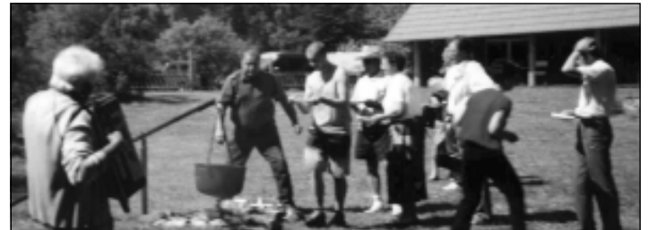
■ Kalaturismi õppepäeval Aravusel- tasub vaid pada tulelt tõsta, kui sööjad ligi...