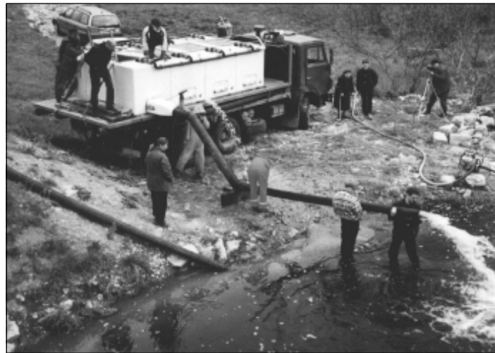
■ Lõhepojad jõkke!

Soomlased tegid huvitava katse: lahte asustati ühes ja samas kohas ning samaaegselt ühesuursi, kuid erineva päritoluga lõhepoegi: