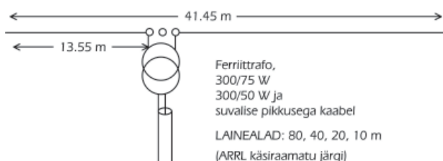
Windowantenni kaabeltoitega versioon

Rothammel, Antennenbuch, uuemad väljaanded, Die Window-Antenne “