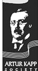
ARTUR KAPP SOCIETY