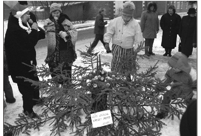
"Las jääda ükski mets"