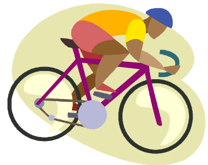
Jalgrattasõit on mitmekülgsest kasulik