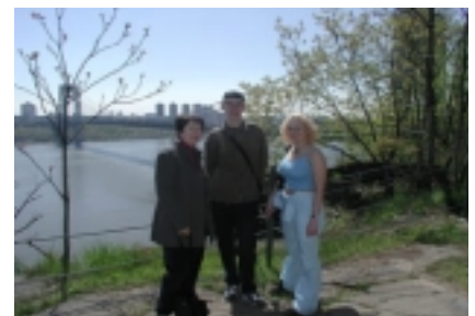
Manhattani taustal New Jerseys