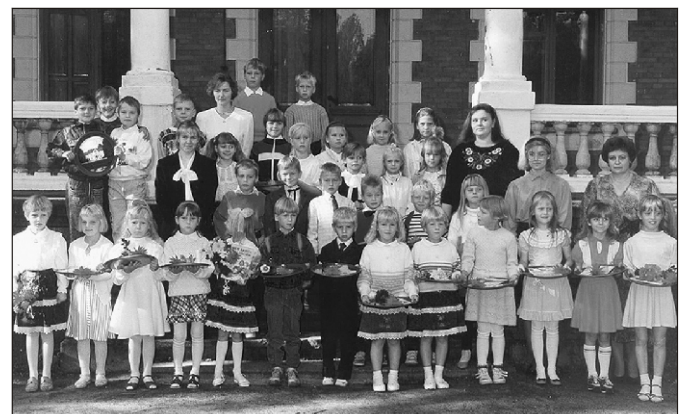
Kogu koolipere 1. septembril 1993

Suur mure on töövahenditega. Kuigi kalmistu rehaid ja muud vahendid on märgistatud, "unustatakse" need tihti oma platsi lähedale puu otsa või põõsasse. Ka teistel on tööriistu vaja. Hooligem üks-teistest rohkem.