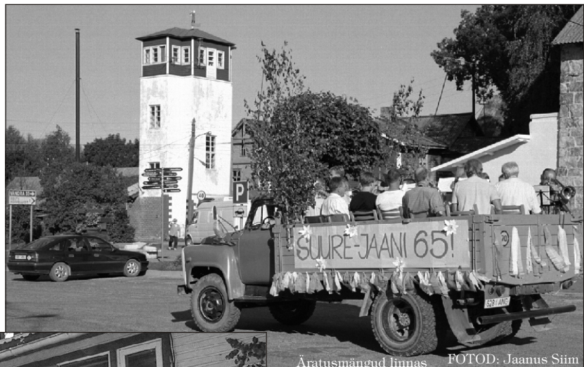
Äratusmängud linnas

Aastapäevavastuvõtule oli Suure-Jaani linn palunud ka oma selle sajandi (s.o kahe eelmise aasta) tublimad maksumaksjad. Kaaluka toetuse eest maksumaksjana said linna tänu-