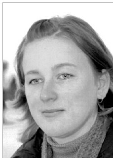
Pildistas ja küsitles Jaanus Siim