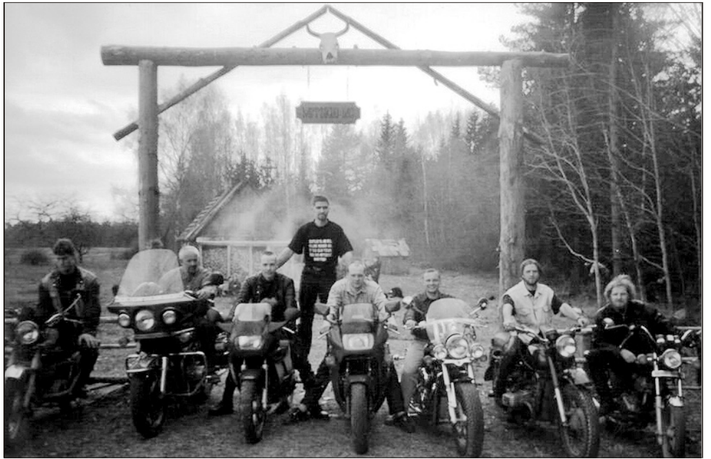
Metsikud oma maja väravas