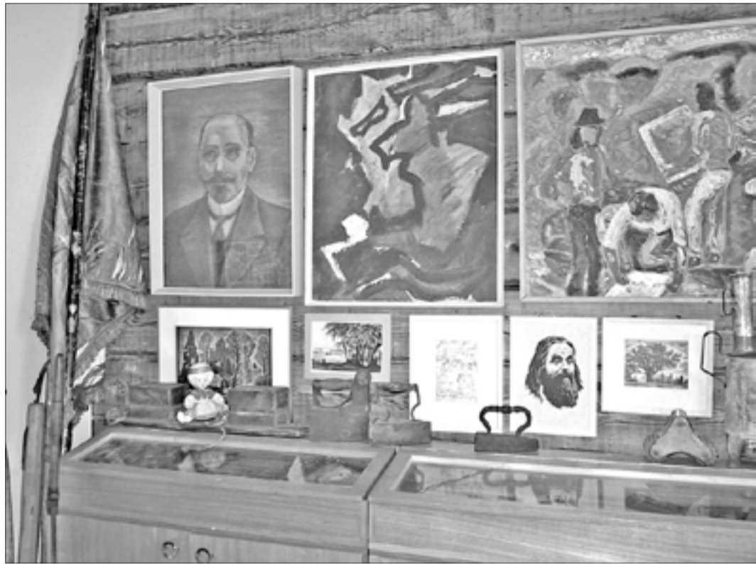
Koolimuuseumis on võimalik süüvida erinevaid valdkondi hõlmavatesse uurimustesse ning heita pilk möödunud aegadel kasutusel olnud tarbeesemetele.

Alates märtsikuust tegutseb vana koolimaja seinte vahel taas Otepää gümnaasiumi muuseum, mis nõukogude ajal pälvis rahvusvahelise tunnustuse ning oli suureks eeskujuks teistele koolimuuseumidele.