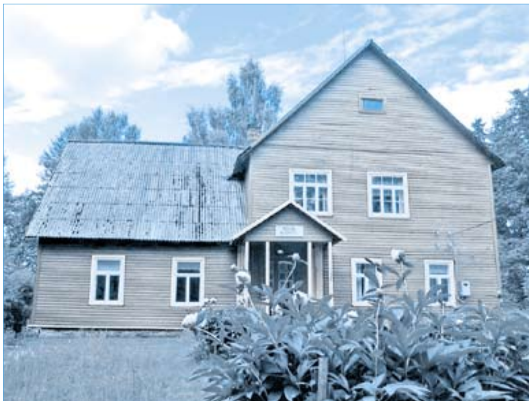
Nõuni vanas koolimajas anti haridust 110 aastat. Sügisel alustab siin tööd küla loodus- ja arenduskeskus.

MARIKA VIKS, Nõuni kooli endine õpilane ja õpetaja