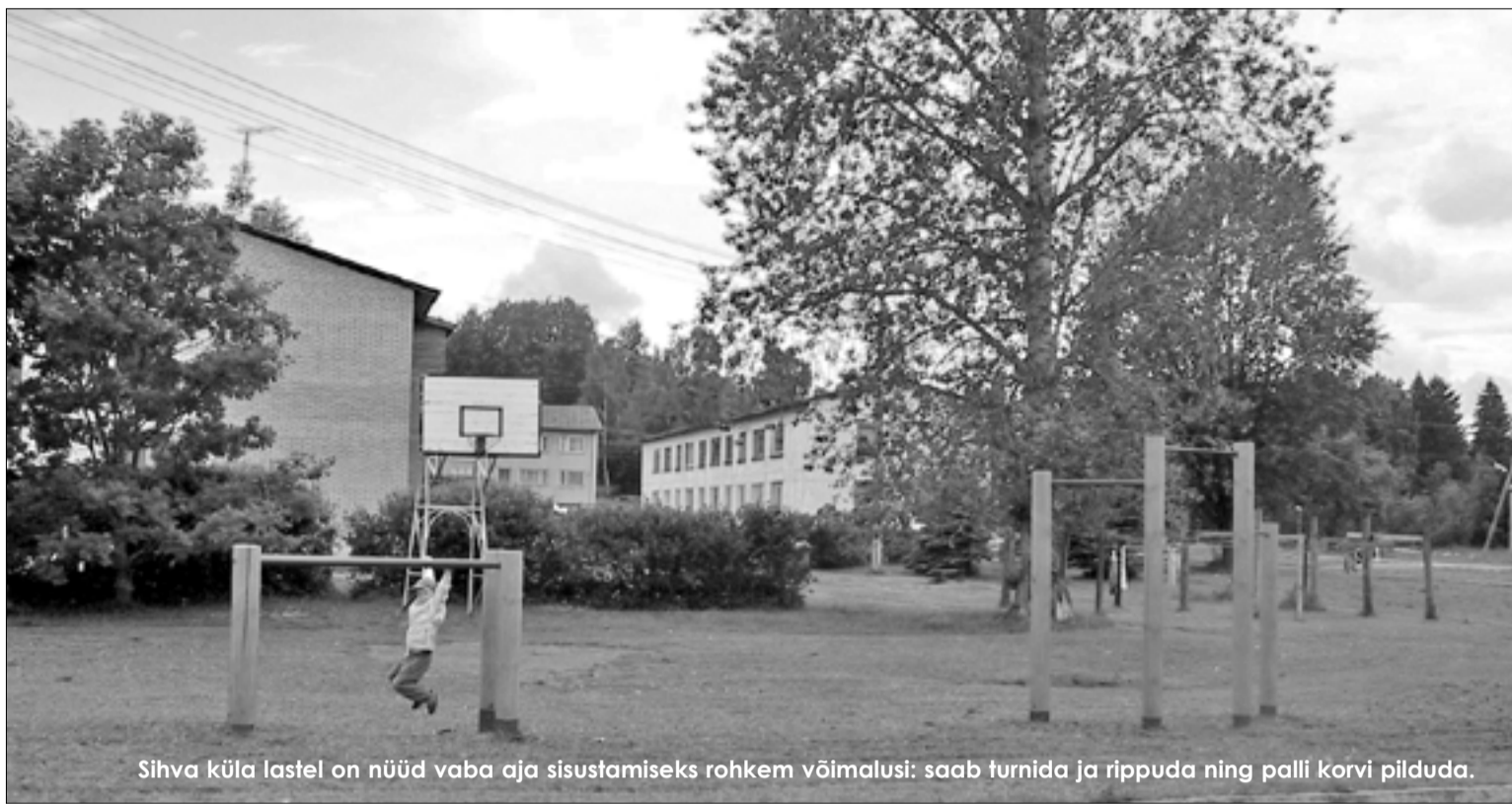
Sihva küla lastel on nüüd vaba aja sisustamiseks rohkem võimalusi: saab turnida ja rippuda ning palli korvi pilduda.

Lähtuvalt valla arengu strateegiast aastani 2007 on valla territooriumil valminud või peatselt valmimas uued paigad aktiivseks vaba aja sisustamiseks lastele ja noortele. Juuni keskel paigaldati mänguväljaku atraktsioonid Sihvale. Valmistajaks ja paigaldajaks oli Tartu firma Vivocard Plus OÜ.