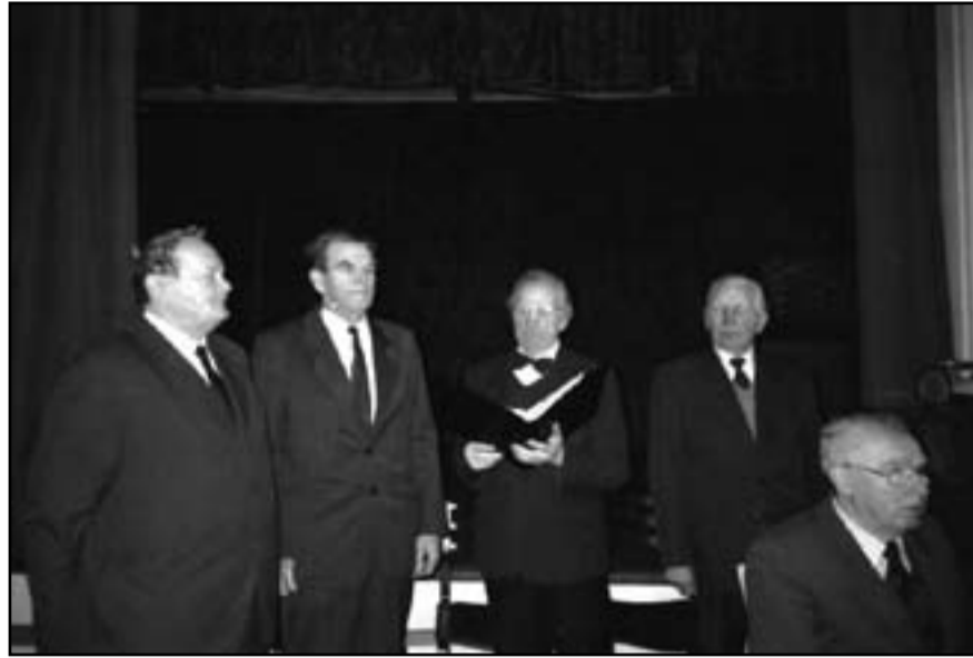
Hellenurme meeskvarterit kutsub oma sünnipäevapeole Hellenurme kultuurimajja 30. aprillil kell 15.

mitmel korral Elvas, Nõunis, järjekordselt külastanud üritust Rannu Kuldnokk ja muidugi korduvalt koduvalla saalis üles astunud.