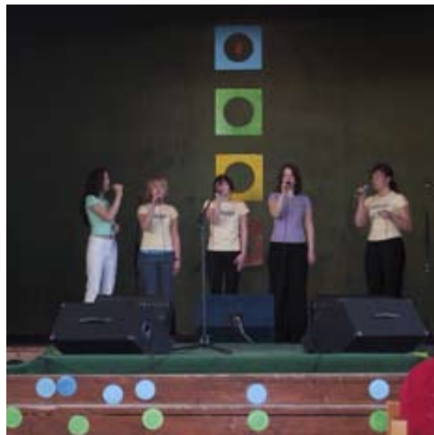
Ansambli kategoorias tunnistas žürii grupi Viva la Musica 2. ülekaalu.