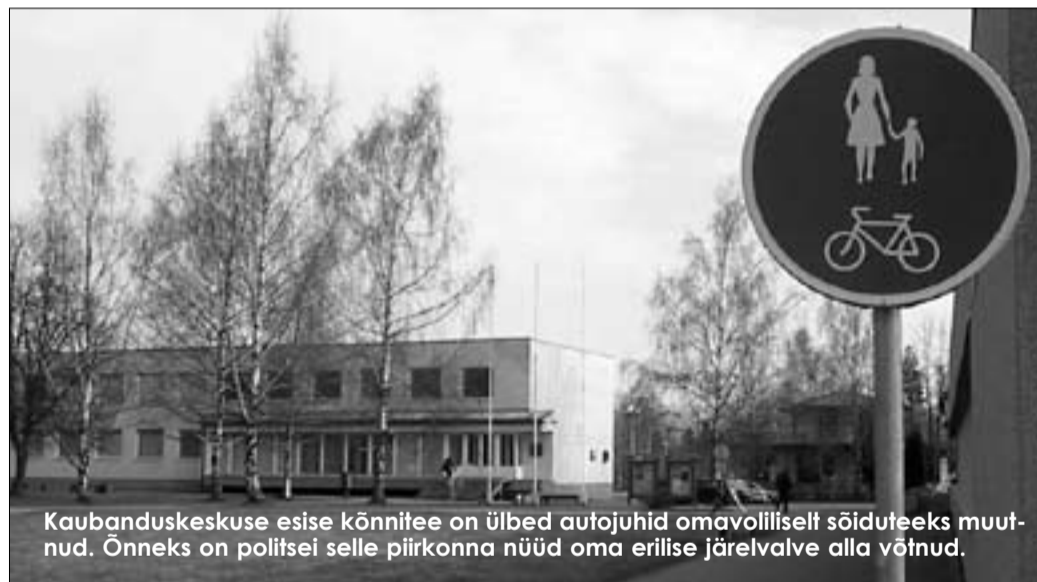
Kaubanduskeskuse esise kõnnitee on ülbed autojuhid omavõlliselt sõiduteeks muutnud. Õnneks on politsei selle piirkonna nüüd oma erilise järelvalve alla võtnud.

Tahaksin jätkata veebruari OTs üles võetud teemat jalakäijatest mittehoolivatest autojuhtidest. Minu jaoks ei olnud selles artiklis küll midagi üllatavat, sest sellist ignorantset ja kahjuks üha süvenevat käitumist autoomanike poolt olen täheldanud juba üsna mitu aastat. Oma roll on siin ka kohalikul omavalitsusel ja politseil, kes arvatavasti on toimuvast küll teadlikud, aga lihtsalt ignoreerivad seda. Kaks näidet: