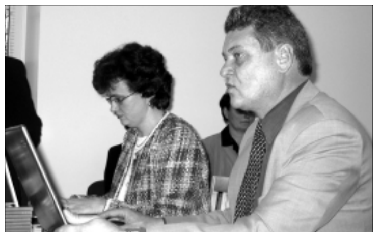
Esiplaanil on Tapa vallavolikogu vastne esimees Aleksander Sile.