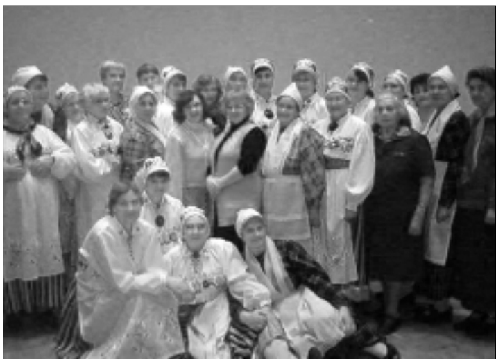
Eakate sügispeol tehti mälestuseks ka ühispilt.