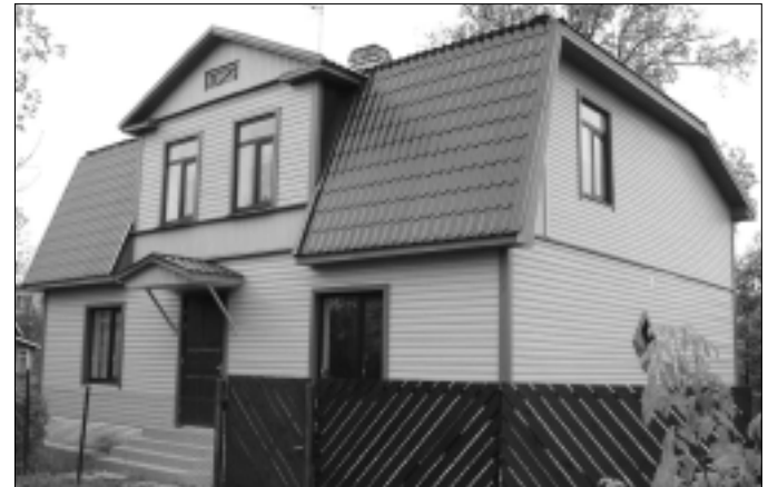
Uue laudvoodri kategoorias peapremia saanud maja aadressil Hommiku 7.