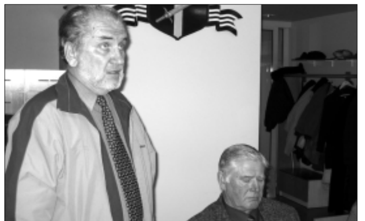
Tapa vallavolikogu vastne aseesimees Andres Mandre kõnelemas.