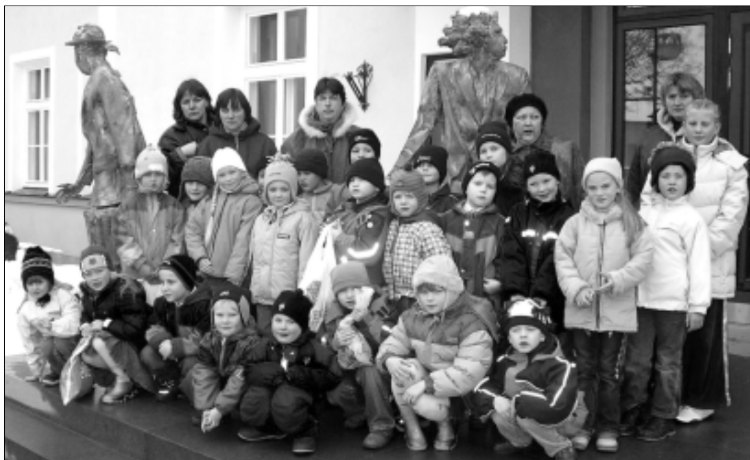
Teatriskäigu meenutuseks tehti ühine pilt vastremonditud teatrihoone ees.

Teatriskäigupäev oli väga siutsihte ja muljeterohke. Esialgne kartus, et päev laste jaoks lii-