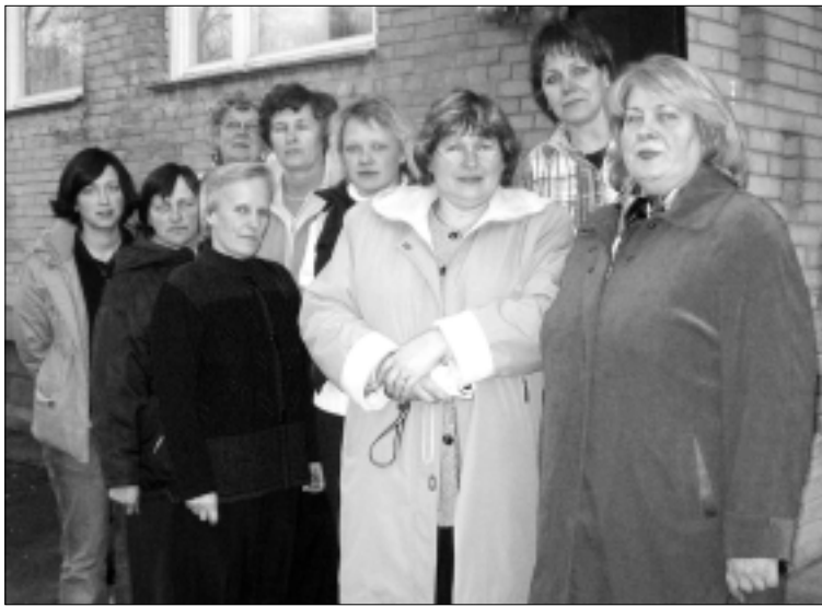
Pisipõnnide õpetajad Maardu lasteaia õppepäeval.