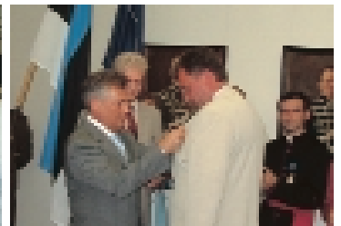
Poola president Aleksander Kwaśniewski kinnitab Harku vallavolikogu esimehe rinda kuldse teeneteristi.