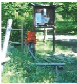
Lõhutatud piire ja infomaterjalide stendil

MTÜ Tabasalu Looduspark juhatuse nimel Kaido Taberland Juhatuse esimees