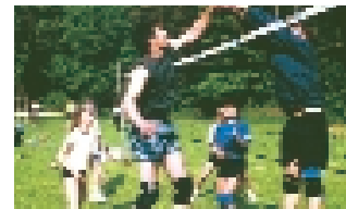
Saue võistkond (paremal) võitmas järjekordseid vastaseid.