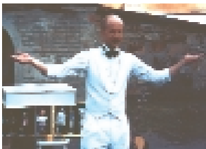
Heino Seljamaa lasteetendus kõitis nii suuri kui väikesed.